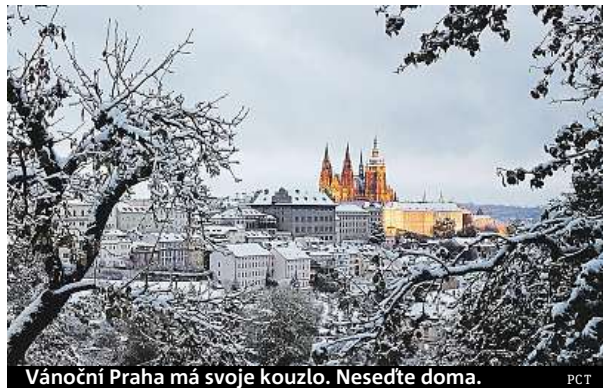
Vánoční Praha má svoje kouzlo. Nesedte doma. PCT

Bojíte se rádi? Můžete zabloudit do uliček v centru.