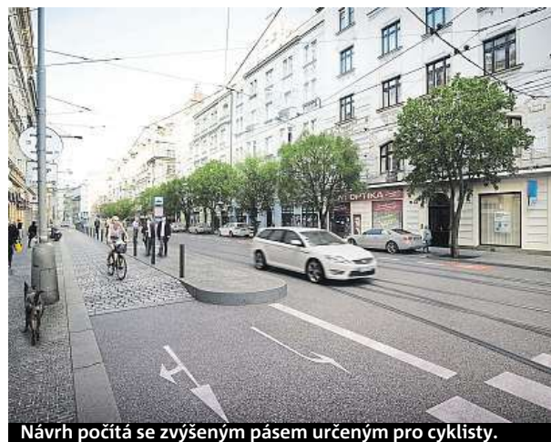
Návrh počítá se zvýšeným pásem určeným pro cyklisty.

Koncepční studie počítá s vybudováním nových a úpravou stávajících přechodů pro chodce a zajistí také jejich bezbariérovost. V rámci rekonstrukce budou upraveny tramvajové zastávky a chodníky. Počítá se s doplněním uličního mobiliáře a podzemních kontejnerů na tříděný odpad. Urbanisté prověřují i podmínky pro doplnění stromořadí. MET