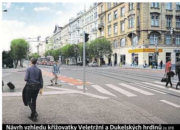
Návrh vzhledu křižovatky Veletržní a Dukelských hrdinů z IPR