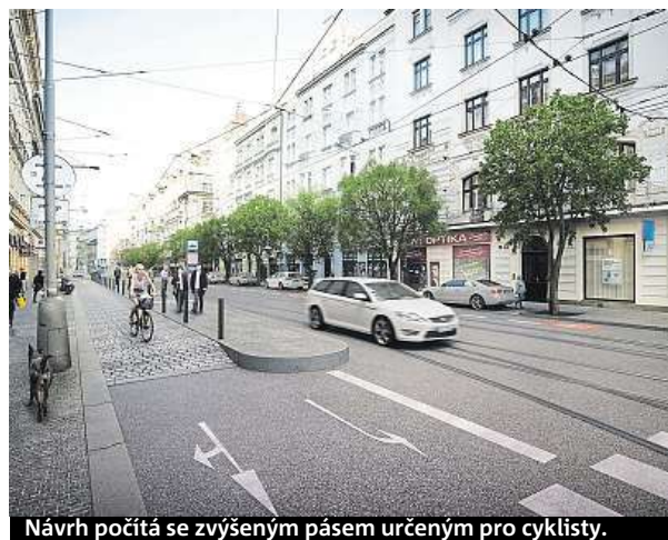
Návrh počítá se zvýšeným pásem určeným pro cyklisty.

Koncepční studie počítá s vybudováním nových a úpravou stávajících přechodů pro chodce a zajistí také jejich bezbariérovost. V rámci rekonstrukce budou upraveny tramvajové zastávky a chodníky. Počítá se s doplněním uličního mobiliáře a podzemních kontejnerů na tříděný odpad. Urbanisté prověřují i podmínky pro doplnění stromořadí. MET