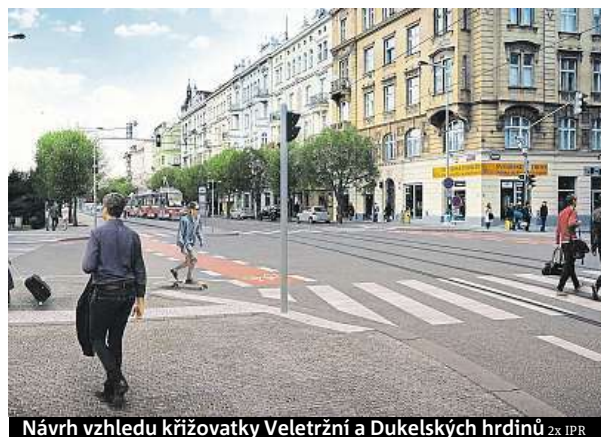
Návrh vzhledu křižovatky Veletržní a Dukelských hrdinů 2x IPR