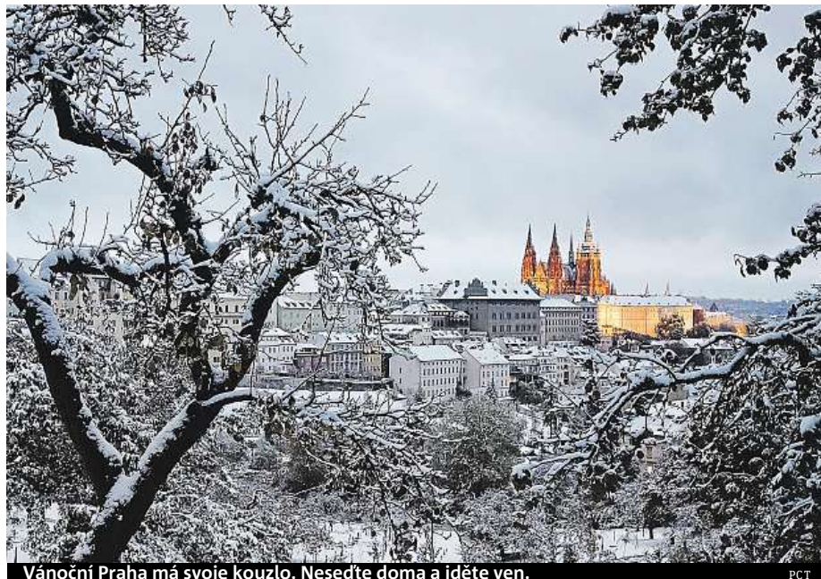
Vánoční Praha má svoje kouzlo. Nesedte doma a jděte ven.