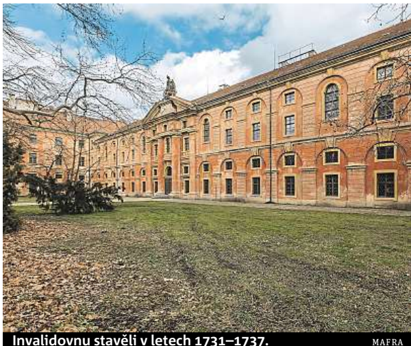
Invalidovnu stavěli v letech 1731–1737.

„Líbilo by se mi zde muzeum rakousko-uherské minulosti českých zemí, galerie