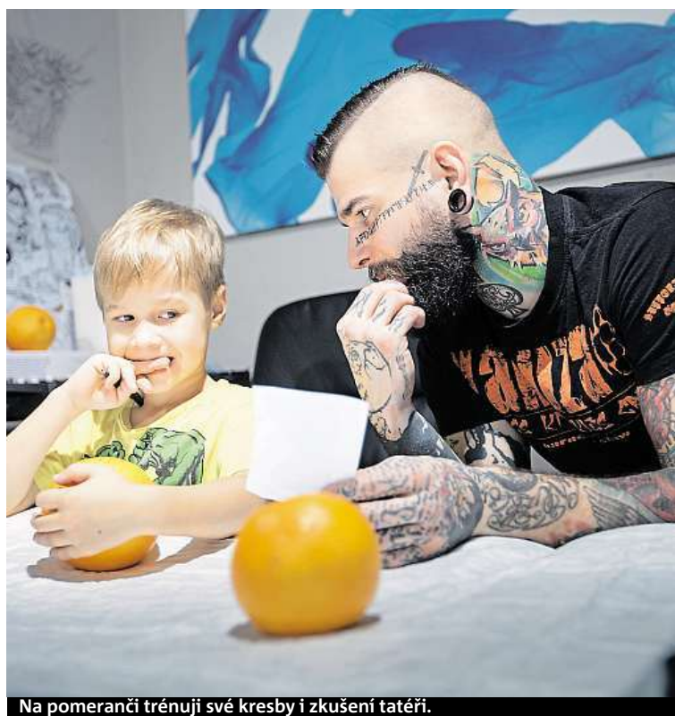
Na pomeranči trénují své kresby i zkušeni tatěři.

zou typu VI, Jeník, který má autistické rysy a mentální postižení. Emilka, jež se narodila s glykogenózou A1, a malá Aida, která zničehonic přestala vidět. MAREK HÝŘ