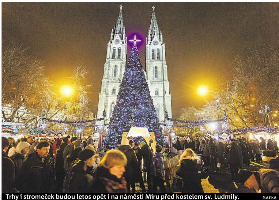
Trhy i stromček budou letos opět i na náměstí Míru před kostelem sv. Ludmily.

Program v třetí městské části bude pestrý. Tradiční Česká mše vánoční J. J. Ryby zazní 4. prosince od 17 hodin v Betlémské kapli v Prokopově ulici v podání Consorsium Pragense Orchestra se sólisty ND a Břevnovským chrámovým sborem pod vedením Adolfa Melichara. Pro děti je připraven 5. 12. od 16 hodin na náměstí Jiřího z Poděbrad Čertovsky popletený Mikuláš.