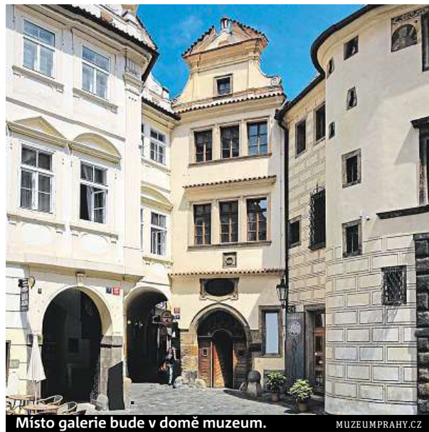
Místo galerie bude v domě muzeum.

Cílem expozice je co nejvěrněji přiblížit podobu měst a život jejich obyvatel v lucem-