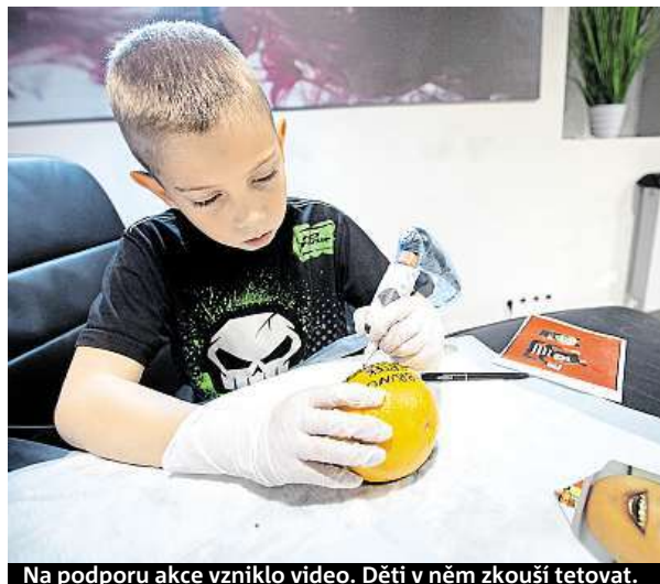
Na podporu akce vzniklo video. Děti v něm zkouší tetovat.

V minulosti mohli tatěři díky štědrým příspěvkům pomoci například dětem s vážnými popáleninami, dětem se zrakovým postižením a dětem v kojeneckém ústavu nebo dětském domově. Letos výtěžek z akce poputuje Centru provázení. „Všechny čtyři rodiny, které jsme pro Pohádkový pomeranč vybrali, říkají, že si nic nepřejí – mnohdy chtějí jen to, aby byla pomoc