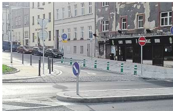
Křižovatka Prokopovy a Rokycanovy ulice.

„Na základě dlouholetých zkušeností nejen s touto kauzou, ale i s mnoha dalšími projekty v oblasti dopravy i projektováním pěších cest jsme přesvědčeni, že k této ani k jiným fatálním nehodám s chodci dojít nemuselo a že je jim možné předcházet mimo jiné vhodnými úpravami dopravního prostoru,“ říká Jar-