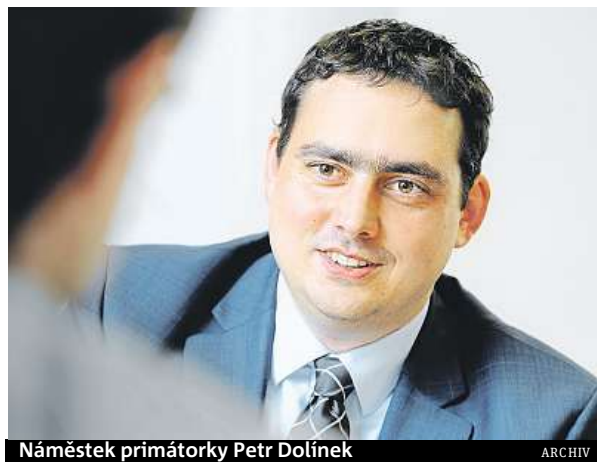
Náměstek primátorky Petr Dolínek