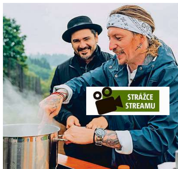
I z fotek to vypadá, že byla zábava. Že byla i sranda. Ale jen při natáčení. Při koukání už to moc vtipné není.

Koktejl, který v něm připomínal Cimrmana, v němž tu nejpříšernější tureckou telenovelu či brakový film od re-