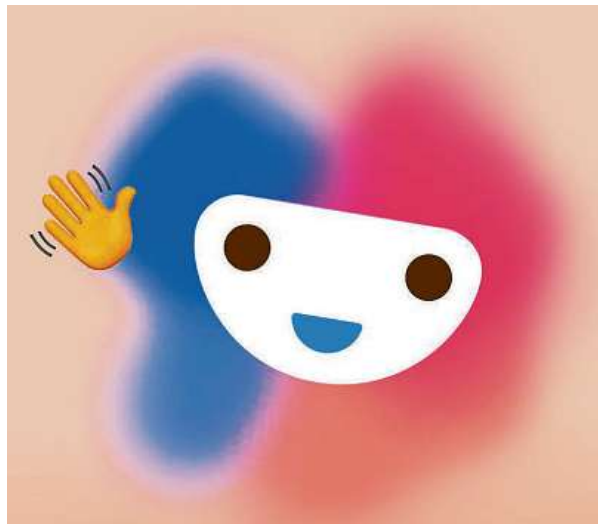
Chatbot Numi funguje jako klasický konverzační robot, jakého můžete znát například z různých e-shopů.

Celkem Numi dokáže odkázat na více než sedmdesát různých kontaktů na konkrétní služby a napíše až dvě stě různých zpráv. „Může ho ale využít každý, kdo by se