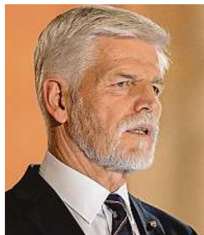
Prezident při proslovu