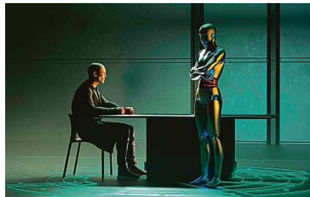
AI lze také využít jako nástroj šikany, nejde však o nic nového, fotomontáže bylo možné dělat i dříve.