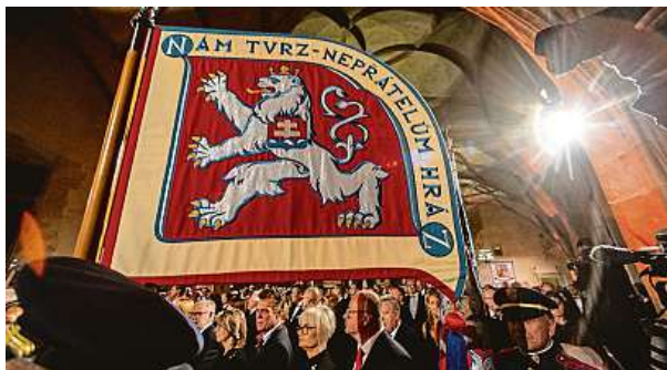
Oslava státního svátku České republiky ve Vladislavském sále