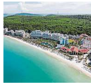
Resort na vietnamském ostrově Phu Quoc FISCHER.CZ

Ostatně Vietnam má mezi doporučenými destinacemi pro podzimní dny také cestovní kancelář Fischer, konkrétně ostrov Phu Quoc. Podle webu této cestovky nejsou nyní k zaholení například ani Kapverdý.