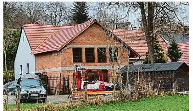
V cihlovém domě na snímku bude nahoře textilní expozice. To bílé za ním je původní mlýn.

„Kapsový dopravník je pás s kapsičkami běžající po řemenicích, který je celý opláštěný dřevem, aby to neprášilo,“ vysvětluje Veverka. Z kapes se obilí sype do takzvaného koukolníku – to je takový dlouhý válec, ve kterém jsou vyfrézované jamky menší než zrno, takže se do něj za-