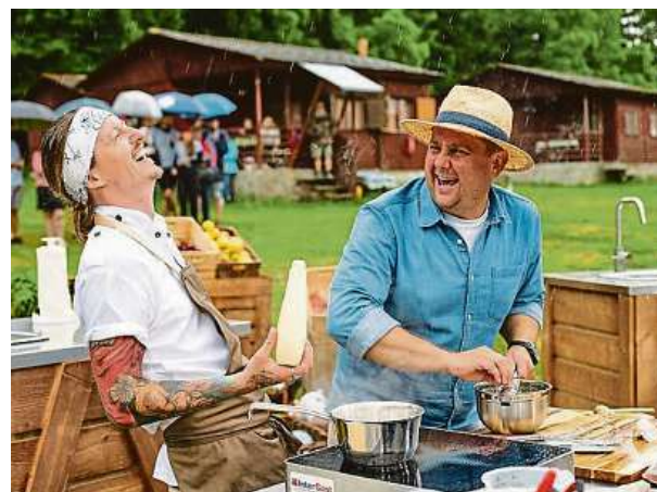
Souboj na talíři ztratil Kašpárka a jde s ním s kopce. Tedy se „soutěžním“ pořadem, Kašpárek udělal nejspíš jen dobře.

žiséra Tomáše Magnuska, napotřetí pořádně zhořkl. Absence bodrého Ostraváka v kombinaci s bezradností scenáristů totiž způsobila, že je to napotřetí děsná nuda. Kdyby oba kuchaři třeba na začátku dostali nějaké dva či tři soutěžní úkoly a pak teprve vařili, mohlo by to celé dávat ještě trochu smysl. Šáněné suroviny však ve třetí řadě nabírá extrémně trapných a nereálných rozměrů. To by nevedilo, kdyby to bylo alespoň trochu vtipné.