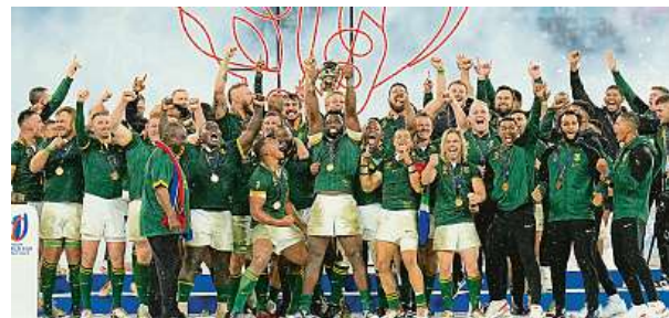
Oslava ragbistů Jižní Afriky po finále mistrovství světa