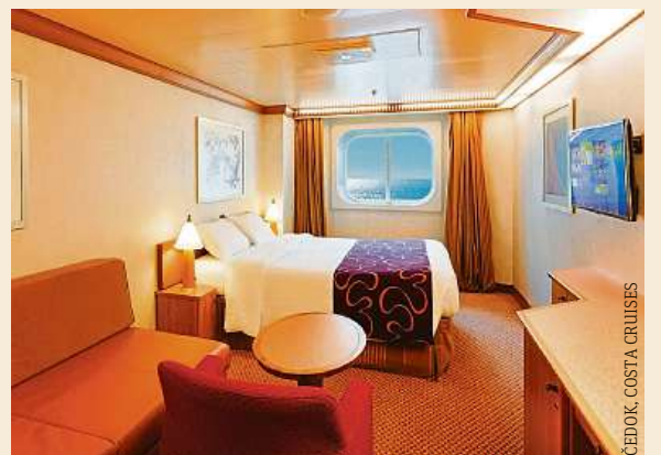
ČEDOK, COSTA CRUISES

Nalodit se na palubu moderních výletních lodí, během cesty zakotvit v přístavech, prohlédnout si místní památky a odvézt si suvenýry z různých zemí, to jsou hlavní důvody, proč turisté volí pro dovolenou okružní plavby. Čedok proto přichází díky spolupráci s Costa Cruises s nabídkou plaveb po Středomoří, Karibiku, Skandinávii nebo po Perském zálivu. MET