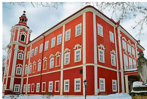
Jako jeden z mála kulturních objektů je zámek Dětenice přístupný veřejnosti i v zimním období.