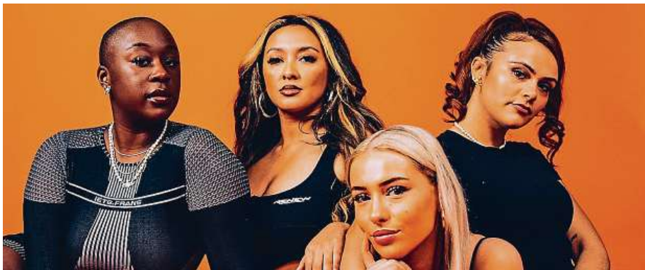
Dýdžejský kolektiv Girls Don't Sync vystoupí ve Futurum Music Baru v sobotu 11. listopadu. Skupina se představila i na letošním festivalu Glastonbury.

Headlinerem pátečního večera bude energická kapela