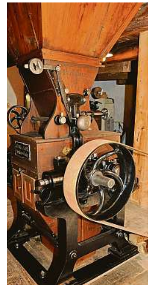
Očištěné a obroušené zrno se mele na válcové mlecí stolici.