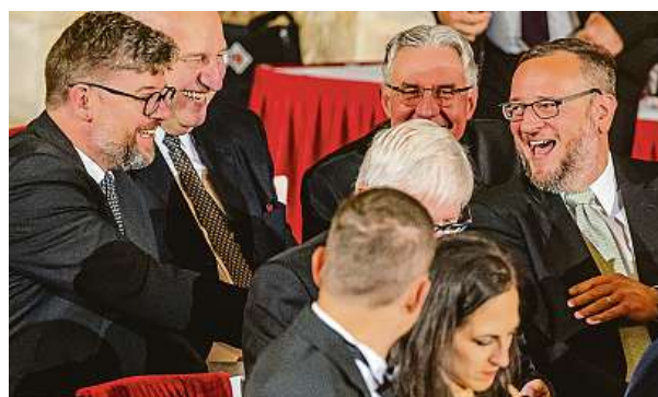
Hosté: Jiří Pospíšil, Jan Zahradil a premiér Petr Nečas...