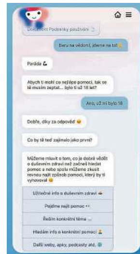
Ukázka konverzace s Chatbotem Numi

„Chtěla jsem vyrobit něco, co pomůže s řešením a zodpoví otázky, které lidi často tíží,“ vysvětluje Opatrná, jejíž „dítě“ odpovídá třeba na to, kdy je vhodná doba na to, říct si o pomoc, nebo jak probíhá první sezení s terapeutem. Počítá i s různými životními situacemi člověka