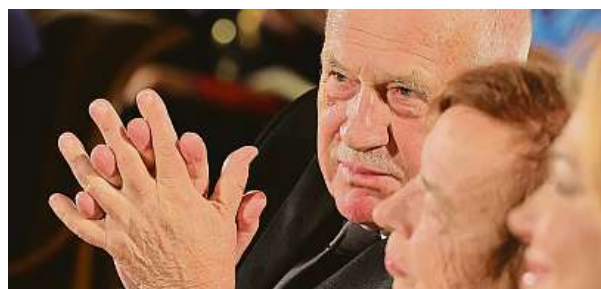
... Václav Klaus, který přišel se svou ženou Lívii.