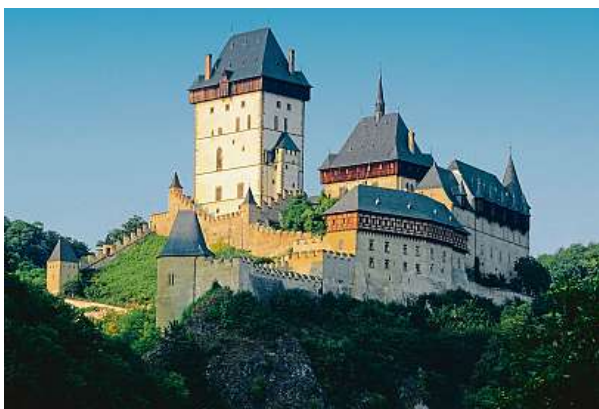
Hrad Karlštejn ve středě zahajuje zimní sezonu. Ta potrvá až do 28. února, kdy bude zase vítat jaro.