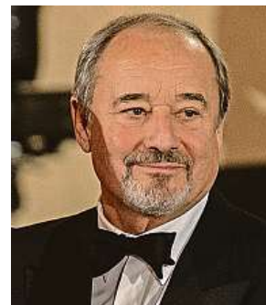
Ocenění byli i Marta Kubišová a Viktor Preiss.