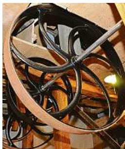
Všechny stroje v mlýně jsou poháněny přes transmisí.