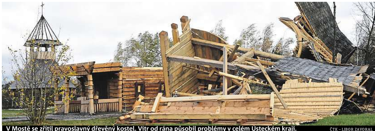
V Mostě se zřítil pravoslavný dřevěný kostel. Vítr od rána působil problémy v celém Usteckém kraji.