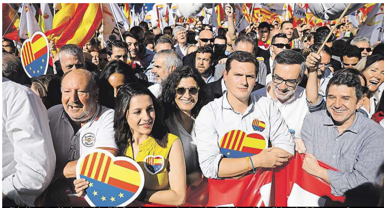
Všichni jsme Katalánsko. Státisíce lidí včera demonstrovaly v Barceloně za jednotné Španělsko. Více čtěte na straně 14