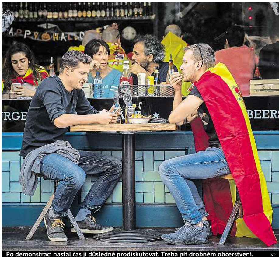
Po demonstraci nastal čas ji důsledně prodiskutovat. Třeba při drobném občerstvení.

a také předsedou Evropského parlamentu. Dorazila i španělská ministryně zdravotnictví Dolors Montserratová či předseda strany Ciudadanos Albert Rivera. Z místních politiků přišel šéf katalánských lidovců Xavier García Albiol či lídr katalánských socialistů Miquel Iceta. IDNES.cz