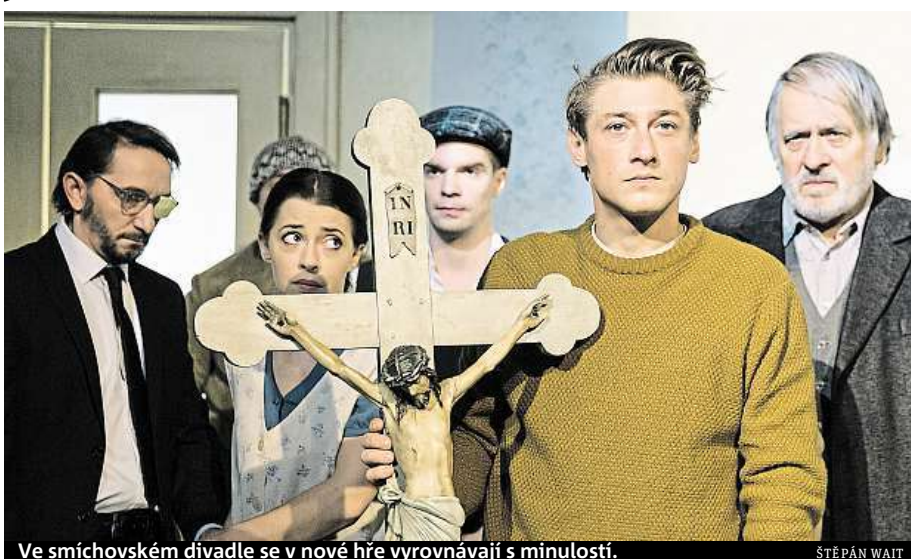
Ve smíchovském divadle se v nové hře vyrovnávají s minulostí.