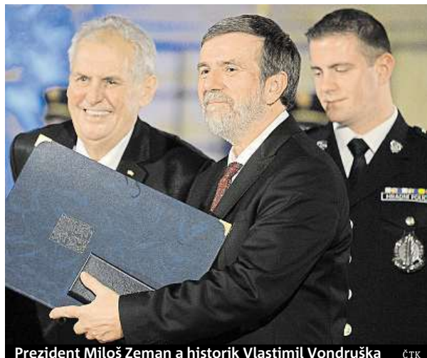
Prezident Miloš Zeman a historik Vlastimil Vondruška