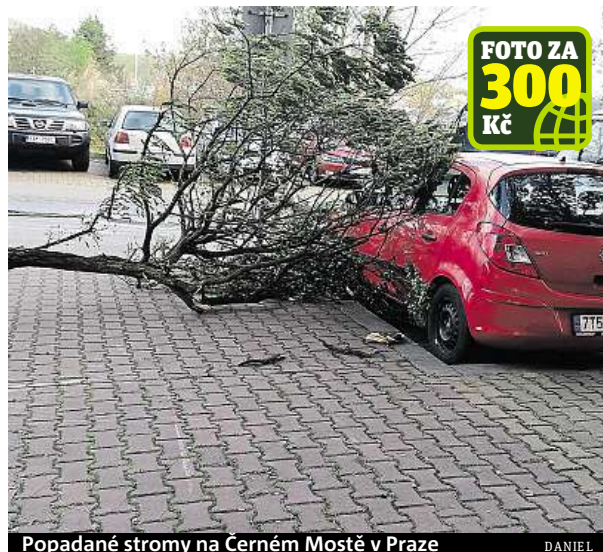
Popadané stromy na Černém Mostě v Praze