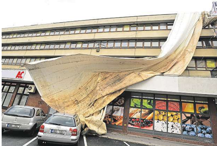
Poškozená střecha nad nákupním střediskem Billa v Kounicově ulici v Brně