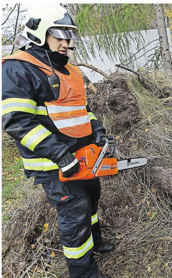
Karlovarští hasiči odklízejí vyvrácený strom.