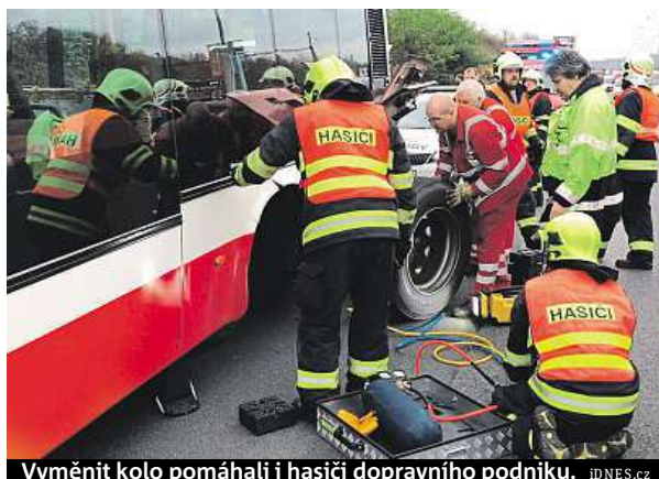
Vyměnit kolo pomáhali i hasiči dopravního podniku.

Deník Metro oslovil dopravní podniky napříč Českem, aby zjistil, jaké povinnosti musí řidič před jízdou splnit. Z odpovědí vyplynulo, že toho není právě málo. „Vše, co má řidič před výjezdem udělat, je popsáno v pokynech, které mají téměř pět stran. Pokud řidič vyjíždí z vozovny, je jeho povinností zkontrolovat čistotu a případné poškození v interiéru i exteriéru. Dále je potřeba zkontrolovat osvětlení, funkčnost dveří, dotažení matic u kol,