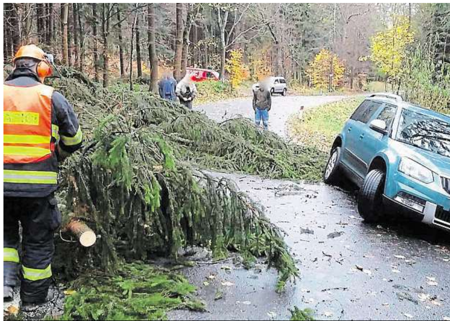
Hasiči v Olomouckém kraji prořezávali stromy na silnici u Mutkova.

V Praze byl kvůli větru uzavřen celý areál Pražského hradu, neotevřela ani zoo a kvůli uvolněné části střechy musel být evakuován Průmyslový palác na Výstavišti. Kvůli nápravě škod bude zoo zavřena ještě dnes. HOP A ČTK