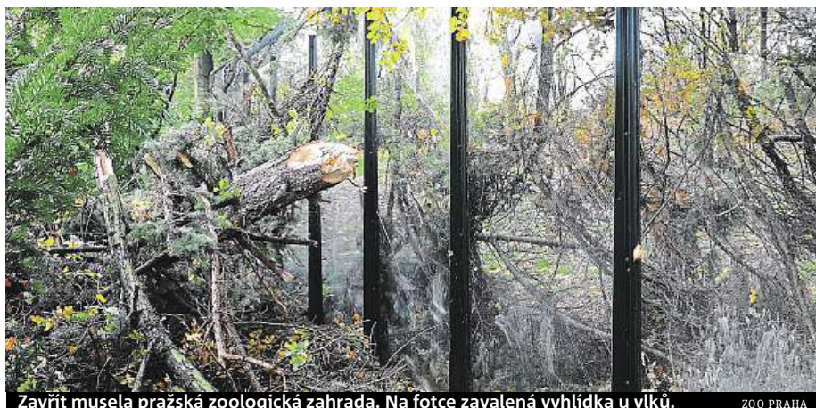
Zavřít musela pražská zoologická zahrada. Na fotce zavalená vyhlídka u vlků.