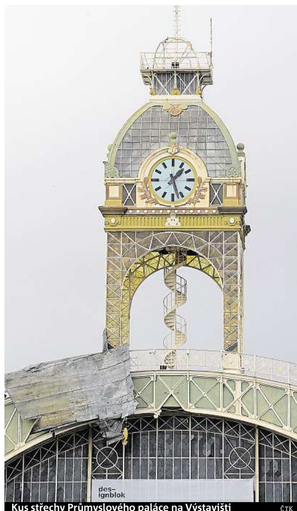
Kus střechy Průmyslového paláce na Výstavišti