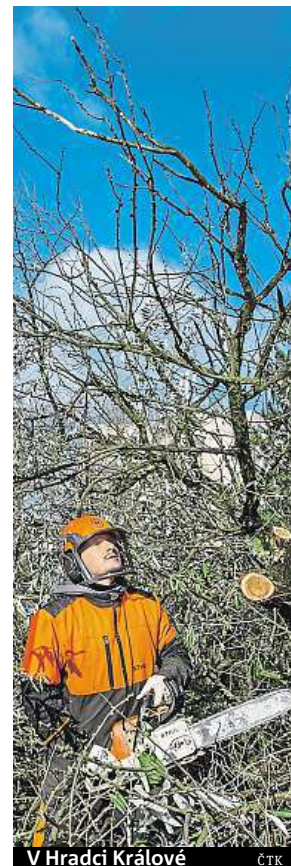
V Hradci Králové