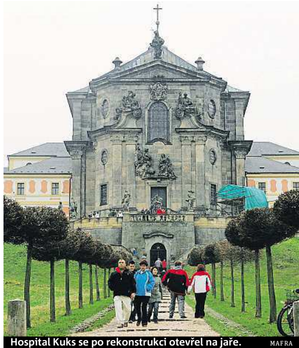
Hospital Kuks se po rekonstrukci otevřel na jaře.

Největší zájem návštěvníků zaznamenal zámek Lednice, jenž o více než dva tisíce překonal magickou hranici tří set padesáti tisíc příchozích. Hrad a zámek Český Krumlov, který v polovině léta tabulku návštěvnosti