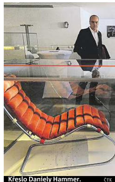
Křeslo Daníely Hammer. ČTK

la s tvůrcem vily, architektem Miesem van der Rohem. Mobilii vily je vyroben z trubek, pásoviny, leštěného dřeva nebo kvalitních hornin. Například na příborníku je sklo z opaxitu. Když se sluneční paprsky odrážejí od stěny z onyxu, která je ve vile, sklo na stole mění barvu do jemné fialové. Příborník připomíná malou stavbu, zatímco kávový stůlek má nožky jako pavouk. Vilu Tugendhat navštíví ročně zhruba 40 tisíc lidí. Zájem o její prohlídku je mimořádný. „Více turistů ročně již z důvodu ochrany vily nelze povolit,“ dodala Iveta Černá. ČTK