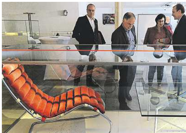
Čtyři původní kusy nábytku jsou zpět ve vile Tugendhat.

Po roce 1989 byly vráceny rodině Tugendhatových. Ve vile nahrazují původní před-