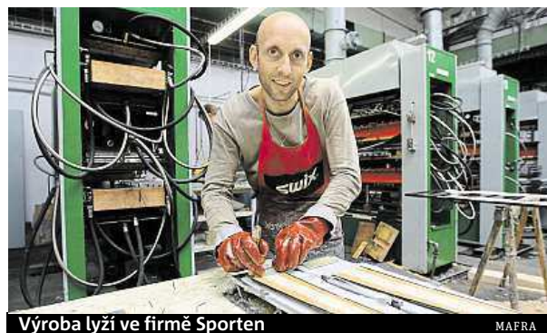
Výroba lyží ve firmě Sporten