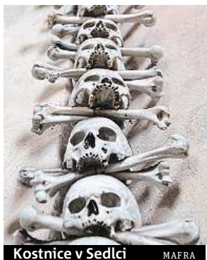
Kostnice v Sedlci MAFRA

Dalším strašidelným místem je Londýn, který nabízí výlety po stopách Jacka Rozparovače. Bát se můžete třeba i v Mexiku během oslav Dne mrtvých. ČTK