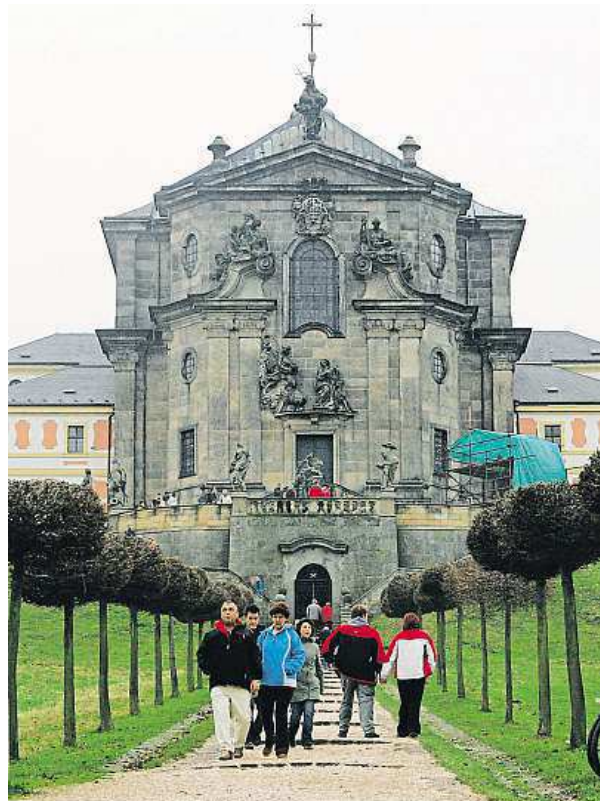
Hospital Kuks se po rekonstrukci otevřel na jaře.

Pomyslným skokanem roku, tedy památkou, která letos zaznamenala opravdu výrazný nárůst zájmu, je národní kulturní památka Hospital Kuks, otevřená po kompletní obnově letos v březnu. Zatímco v letech před opra-