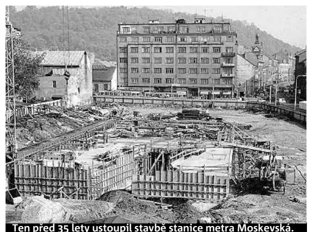
Ten před 35 lety ustoupil stavbě stanice metra Moskevská.