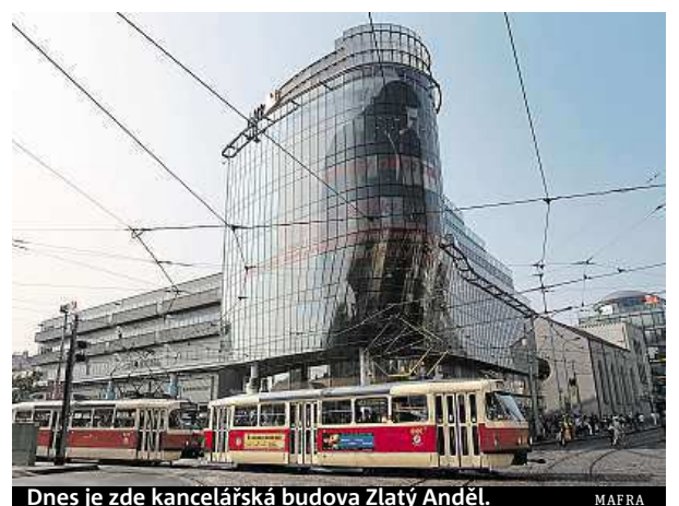
Dnes je zde kancelářská budova Zlatý Anděl. MAFRA