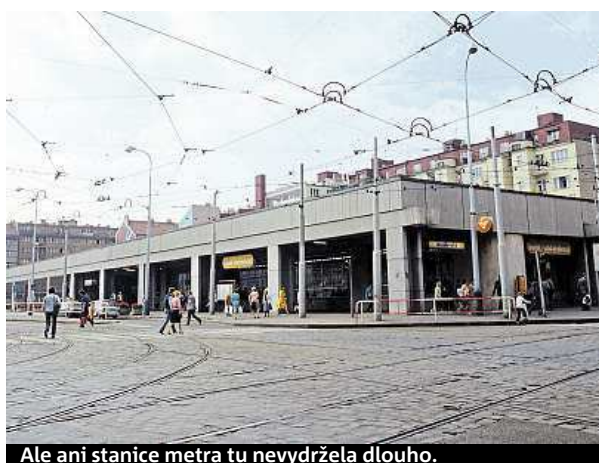
Ale ani stanice metra tu nevydržela dlouho.