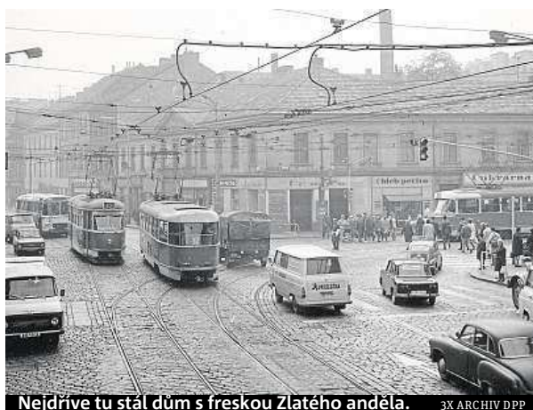
Nejdříve tu stál dům s freskou Zlatého anděla.

Výročí trasy B připomene i dopravní podnik. V neděli a v pondělí proto do provozu opět zamíří historická souprava metra 81-71, která bude vozit cestující. ROW