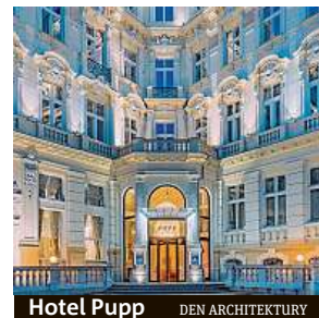
Hotel Pupp DEN ARCHITEKTURY

Od zítřka se po celé zemi koná festival Den architektury.