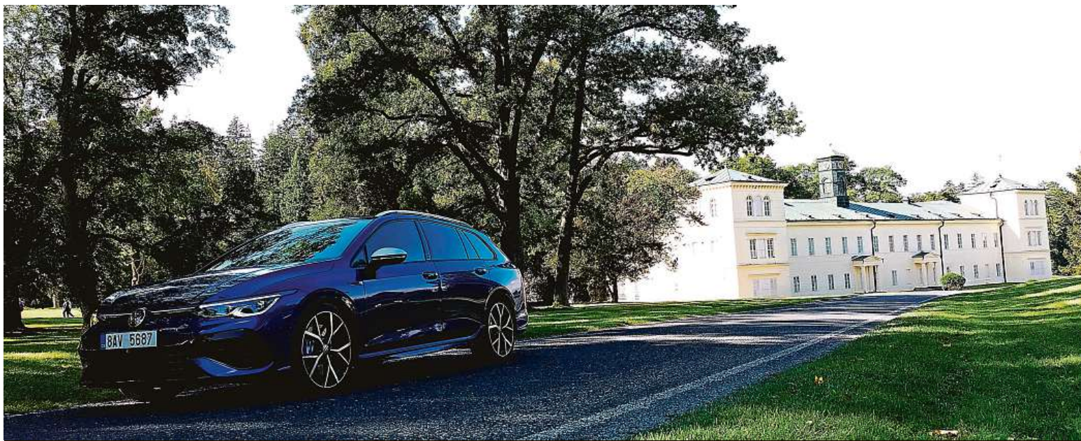
Volkswagen Golf R Variant a jeho sportovní proporce. Na pozadí státní zámek Kynžvart, který je designován naopak ve stylu klasicismu.