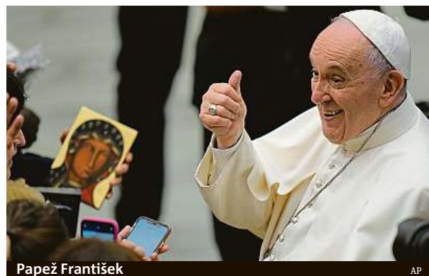
Papež František

Svatý otec během letu ze své nedávné návštěvy Slo-