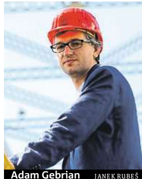
Adam Gebrian JANEK RUBEŠ