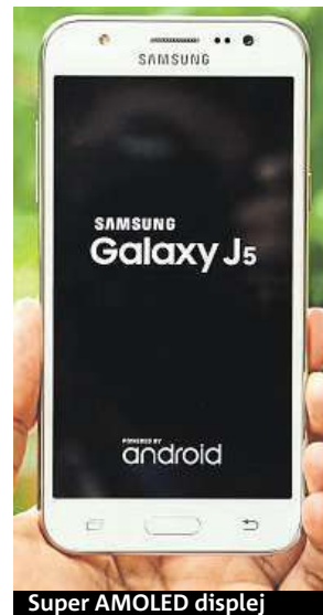
Super AMOLED displej

Ani tento model nebyl ochuzen o populární 5" Super AMOLED displej se sytými barvami a nepřekonatelnou černou.