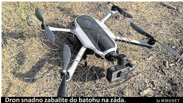
Dron snadno zabalíte do batohu na záda.

S dronem si samozřejmě báječně vyhrájete i bez kamery, ale ta správná filmářská zábava začíná teprve po připevnění kompatibilní kamery. Adepty na možnou spolupráci jsou obě novinky – Hero 5 Black či Session a starší modely Hero 4 Black nebo Silver. Kamera se upevňuje na tzv. tříosý gimball, který lze z dronu vyjmout a použít také jako ruční stabilizátor. Tím je docíleno perfektně ostrých akčních záběrů bez rozklepaného obrazu. Ovládání na vzdálenost až 1 km, prostřednictvím dálkového ovladače s in-