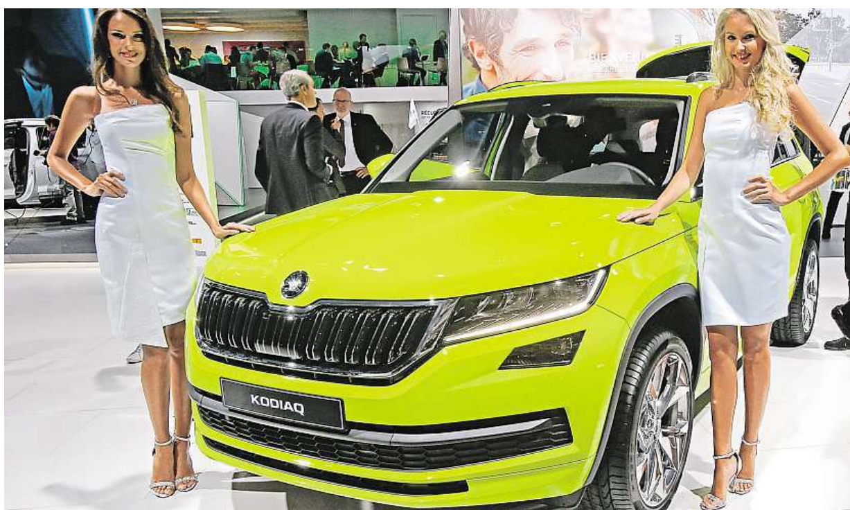
Cena nového velkého SUV Kodiaq od Škody Auto bude v České republice začínat na 677 900 korunách českých. Více strana 2

Daň z nabytí nemovitosti. Už za měsíc ji nově místo prodávajícího zaplatí kupující. Byt za tři miliony. Připravte si navíc 120 tisíc korun. Změna. Nejvíce se dotkne těch, kteří spoléhají na hypotéky STRANA 2