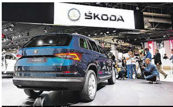
Nová škodovka v Paříži