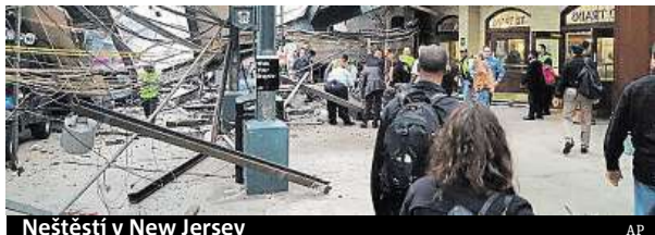
Neštěstí v New Jersey

neštěstí ukazují citelně poškozené nástupiště a částečně zřícený strop. Poničen byl i samotný vlak. „Najednou přišel náraz, zhasla světla, lidé padali jako kuželky,“ uvedl na Twitteru jeden ze svědků. Příčina není jasná. ČTK