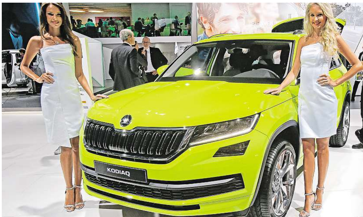
Cena nového velkého SUV Kodiaq od Škody Auto bude v České republice začínat na 677 900 korunách českých. Více strana 2 AP

Daň z nabytí nemovitosti. Už za měsíc ji nově místo prodávajícího zaplatí kupující. Byt za tři miliony. Připravte si navíc 120 tisíc korun. Změna. Nejvíce se dotkne těch, kteří spoléhají na hypotéky STRANA 2