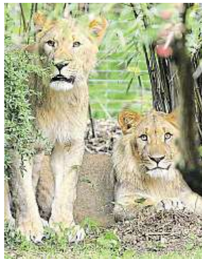
Dvojice lvů z lipské zoo

Šelmy se z výběhu v lipské zoo dostaly před otevřením.