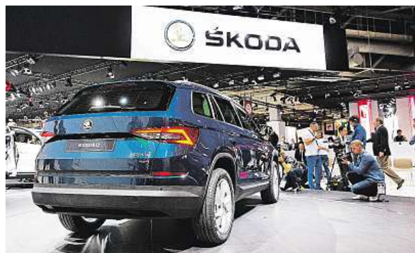
Nová škodovka v Paříži