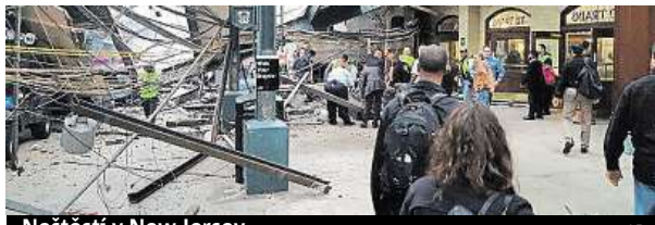
Neštěstí v New Jersey

neštěstí ukazují citelně poškozené nástupiště a částečně zřícený strop. Poničen byl i samotný vlak. „Najednou přišel náraz, zhasla světla, lidé padali jako kuželky,“ uvedl na Twitteru jeden ze svědků. Příčina není jasná. ČTK