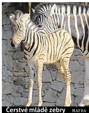
Čerstvé mládě zebry

Zoo Jihlava je rozdělena do pěti kontinentů a nachází se v malebném údolí řeky Jihláv-