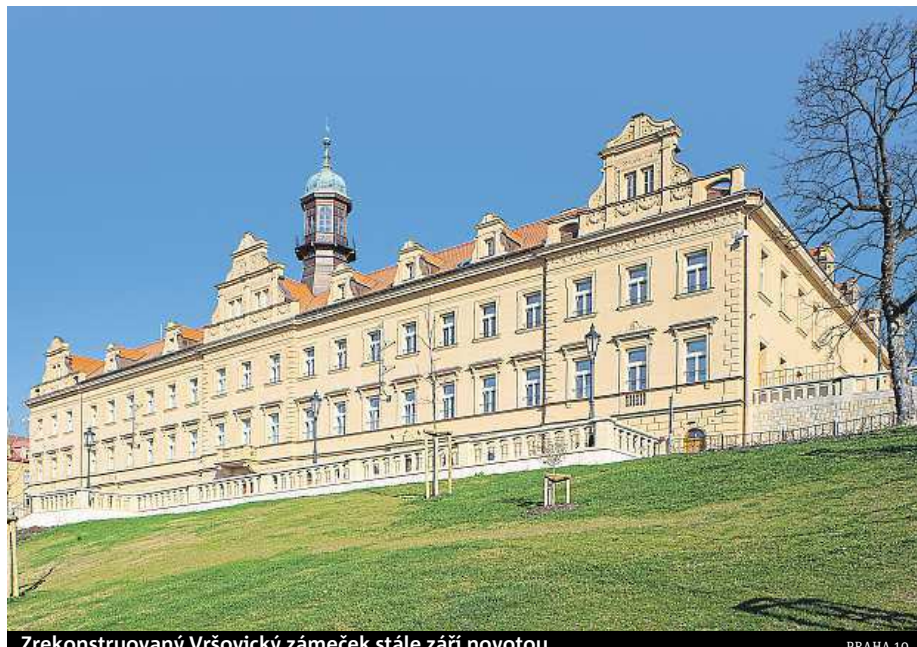
Zrekonstruovaný Vršovický zámek stále září novotou.