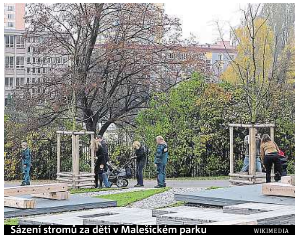
Sázení stromů za děti v Malešickém parku

Nově se bude ročně sázet asi 200 až 250 stromů. Do projektu se musí rodiče hlásit při vítání občánků. PAVEL URBAN