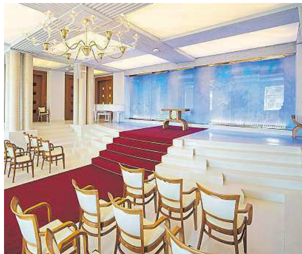
Nádherná obřadní síň neslouží jen pro svatby.