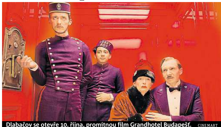
Dlabačov se otevře 10. října, promítnou film Grandhotel Budapešť.