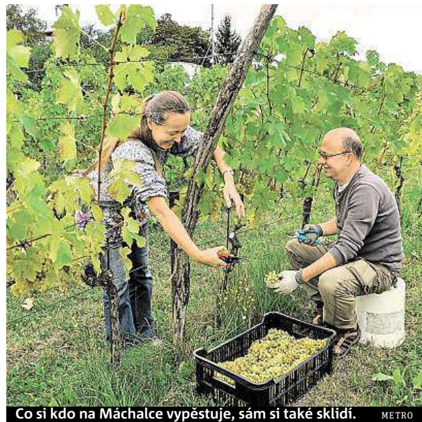
Co si kdo na Máchalce vypěstuje, sám si také sklízí. METRO

Nejaktuálnější informace najdete na našich web stránkách! www.creditczech.cz