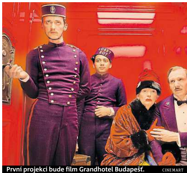
První projekcí bude film Grandhotel Budapešť . CINEMART