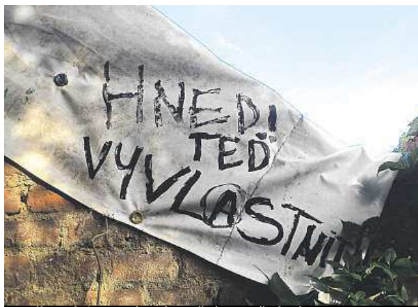
Podle radnice není vyvlastnění na pořadu dne.