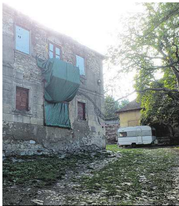
Majitel usedlosti Oldřich Vaniček tvrdí, že chce areál opravit.