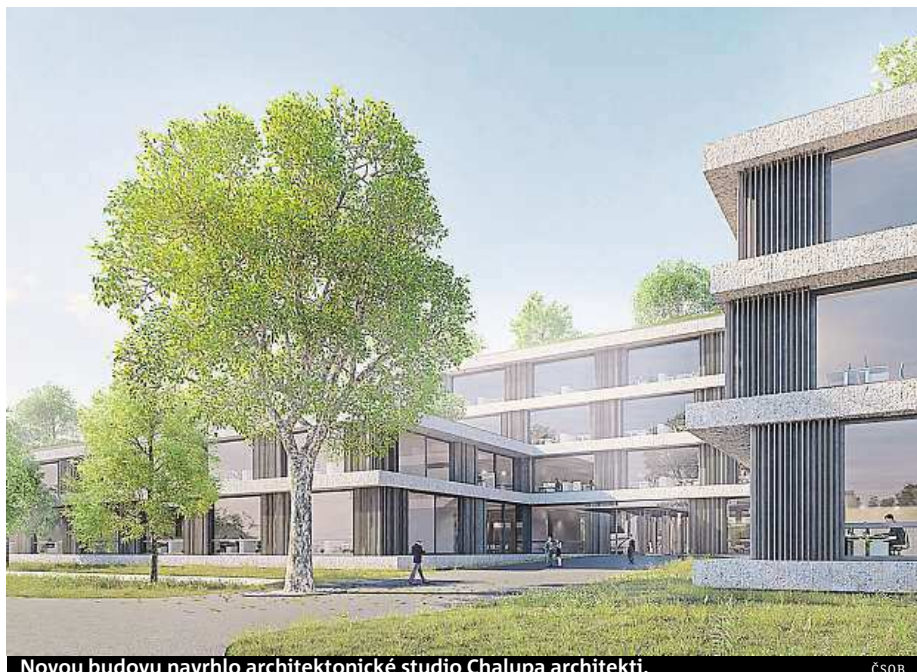
Novou budovu navrhlo architektonické studio Chalupa architekti.

Kříčková. Novou budovu navrhlo architektonické studio Chalupa architekti. Termín jejího dokončení zatím není znám. Podle tvůrců je pro banku rozhodující kvalita výsledku. Termíny jsou proto sice významné, ale nikoli nejpodstatnější parametry projektu. Orientačně tedy platí, že začít stavět by se mělo příští či přespříští rok a první zaměstnanci by se do nové budovy měli přestěhovat zhruba o dva roky později. ROW