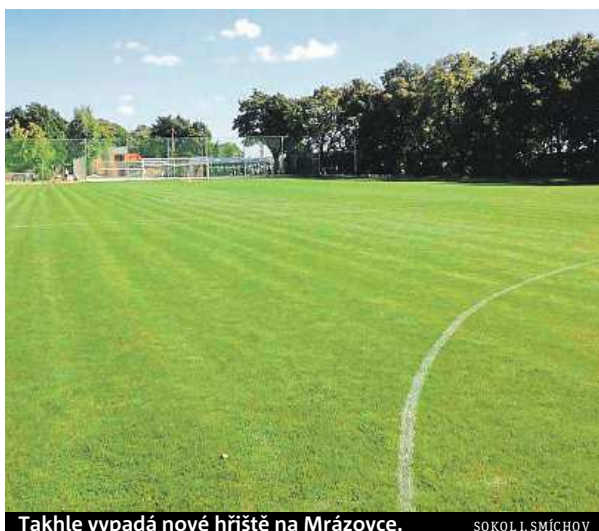
Takhle vypadá nové hřiště na Mrázovce.