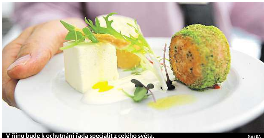
V říjnu bude k ochutnání řada specialit z celého světa.