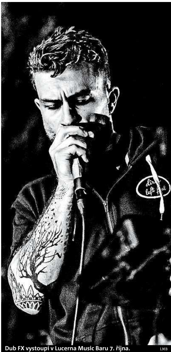
Dub FX vystoupí v Lucerna Music Baru 7. října. LMB