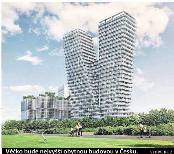
Věčko bude nejvyšší obytnou budovou v Česku. VTOWER.CZ

Nové komplexy nemají velkou podporu místních ani radnice, přesto před prázdninami byla úspěšně zkolaudována společností Passerin-