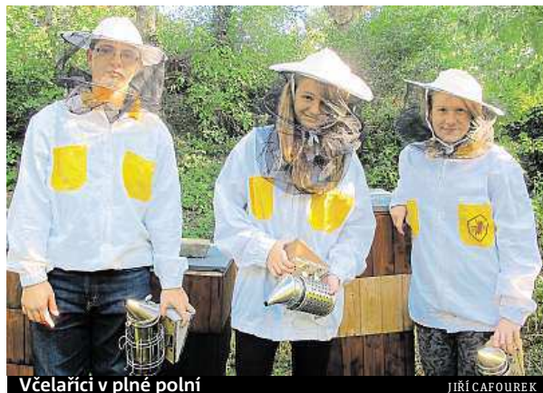
Včelařící v plné polní

Neučíme děti jen včelařinu, ale snažíme se jim přiblížit široké zákonitosti přírody a teprve přes ně se dostáváme k hmyzu, pestré škále opylovačů rostlin a nakonec i ke včelám. Praktickou i teoretickou výuku včelařských znalostí a dovedností prokládáme hrami, soutěžemi a výukou dalších potřebných dovedností. Takže se zde učí například mikroskopování, fotohrafování, botaniku.