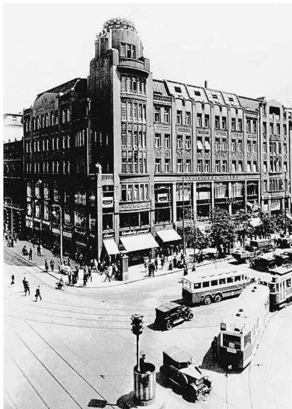
V časech největší slávy, když ještě kolem jezdily tramvaje

To vše teď připomíná nová výstava nainstalovaná na velkoplošných panelech v pasáži paláce. ROW