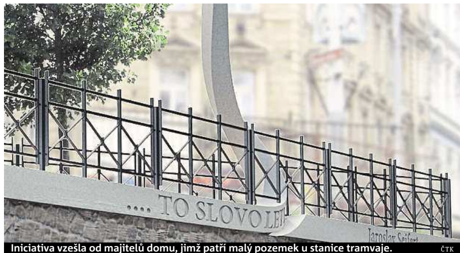
Iniciativa vzešla od majitelů domu, jimž patří malý pozemek u stanice tramvaje.