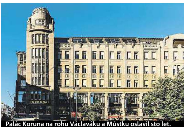
Palác Koruna na rohu Václaváku a Můstku oslavil sto let.