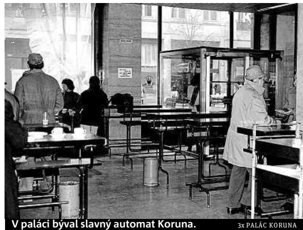
V paláci býval slavný automat Koruna.