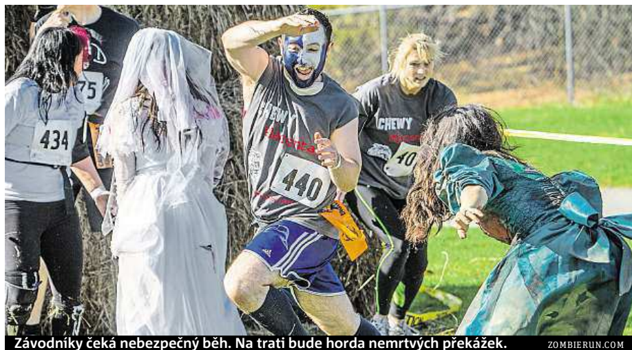
Závodníci čeká nebezpečný běh. Na trati bude horda nemrtvých překážek. ZOMBIERUN.COM

Fenomén zombie v posledních letech získává na popularitě, stejně jako běhaní. Na Zombie night runu si na své přijdou jak fanoušci ožvlých mrtvol, tak soutěživí jedinci, kterým jde hlavně o to, co nejrychleji protřhnout cílovou pásku. „Máme akci rozdělenou ve třech úrovních. První kategorie jsou běžci, kteří