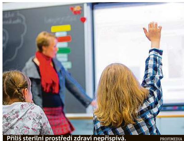
Příliš sterilní prostředí zdraví nepřispívá.

Jeho organismus na to není zatím připraven, proto ho může skolit kdekjaká viróza nebo angína. Pokud dítě žije v téměř sterilním prostředí, bývá přestup do školky ještě