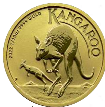
Zlatá investiční mince Australian Kangaroo 1/10 Oz Cena: 5400 Kč*