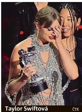
Taylor Swiftová

Na velkolepé show se objevil i Johnny Depp.