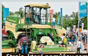
Stroje, které pomůžou zemědělcům.