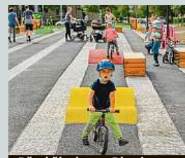
Před školou v Plzni ČTK

Plzeňská základní škola Slovanská alej má prostor před areálem nově upraven dle přání svých žáků, kteří ho sami pomohli navrhnout. Jedná se o ojedinělý projekt spolupráce dětí, architektů a školy. ČTK