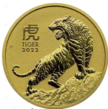
Zlatá investiční mince Rok Tygra 1/10 Oz Cena: 6200 Kč*

Zlato je vyhledávanou investicí, která plní více funkcí a poučeným investorům jednoznačně přináší užitek. Díky tomu, že lze koupit zlato již od jednoho gramu, může si jeho nákup dovolit každý, komu na konci měsíce na účtu zůstávají volné finanční prostředky. Stejně jako u jiných oblastí, také investice do zlata s sebou nese určitá rizika, na která je třeba myslet předem.