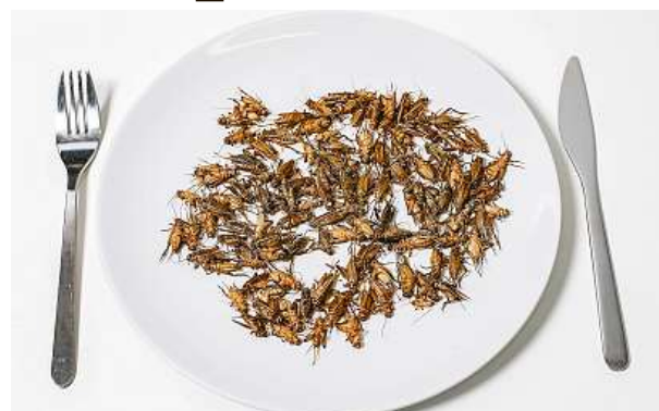
Cvrčci k obědu? Mají kvalitní bílkoviny jako maso.

Potravina, která nebyla v EU typická před rokem 1997, potřebuje vyjádření Evropského úřadu pro bezpečnost potravin. Evropská komise přijala doporučení úřadu pro tři druhy, schválila je jako nové potraviny. Dalších devět bude projednávat. Důvodů, proč hmyz takto využít, je podle vědkyně víc. Má například oproti ostatním zvířatům nižší spotřebu zemědělské půdy a potřebuje poměrně málo vody. ČTK