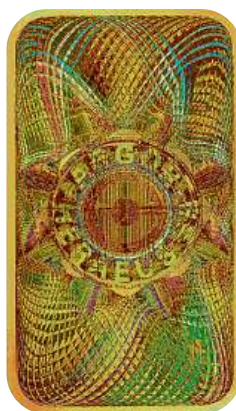
Investiční zlatý slítek Argor-Heraeus Kinebar 2g Cena: 3800 Kč*