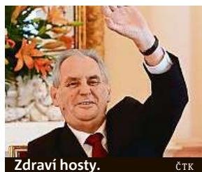
Zdraví hosty.

Prezident Miloš Zeman odmítl snahy některých českých politiků usilujících o odchod našich vojáků z Afghánistánu. „U Kábulu se bojuje za Prahu, odejít by dokázal jen srab,“ řekl prezident v projevu před českými velvyslanci. Když opustíme Afghánistán, ovládne ho podle prezidenta Zemana Tálibán a budeme tu mít nový Islámský stát. Odpůrcům české účasti v Afghánistánu se podle něj nemá nadávat, ale má se s nimi diskutovat. Ke kritikům mise patří kromě extrémních stran KSČM a SPD i poslanec ODS Václav Klaus mladší. Zeman zalitoval toho, že se dosud velvyslanci v USA Hynku Kmoníčkoví nepodařilo vyjednat setkání českého prezidenta s americkým prezidentem Donaldem Trumpem. „Každý není tak schopný velvyslanec jako Eva Filipí,“ pochválil českou zastupitelku v Damašku. IDNES.cz