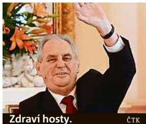
Zdraví hosty.

Prezident Miloš Zeman odmítl snahy některých českých politiků usilujících o odchod našich vojáků z Afghánistánu. „U Kábulu se bojuje za Prahu, odejít by dokázal jen srab,“ řekl prezident v projevu před českými velvyslanci. Když opustíme Afghánistán, ovládne ho podle prezidenta Zemana Tálibán a budeme tu mít nový Islámský stát. Odpůrcům české účasti v Afghánistánu se podle něj nemá nadávat, ale má se s nimi diskutovat. Ke kritikům mise patří kromě extrémních stran KSČM a SPD i poslanec ODS Václav Klaus mladší. Zeman zalitoval toho, že se dosud velvyslanci v USA Hynku Kmoníčkoví nepodařilo vyjednat setkání českého prezidenta s americkým prezidentem Donaldem Trumpem. „Každý není tak schopný velvyslanec jako Eva Filipí,“ pochválil českou zastupitelku v Damašku. IDNES.cz