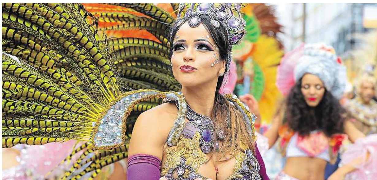
Notting Hill Carnival. Včera skončil v Londýně největší pouliční festival v Evropě. Více na straně 3

Praha. Zažívá boom sdíleného bydlení. Bezpečnostní riziko. Chybí evidence hostů. Problém. Dřív šlo hlavně o nocování u místních, teď se to ale mění jen na pronájem, říká šéfka Prague City Tourism Nora Dolanská STRANA 2