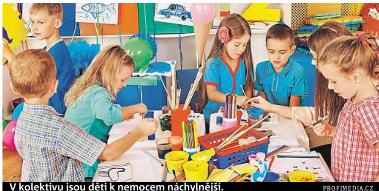
V kolektivu jsou děti k nemocem náchylnější.

Většinu běžných infekcí si dítě musí prodělat, před těmi závažnými je nutno se chránit očkováním. Normální ale není, pokud je frekvence nemocí příliš vysoká, objevují se těžké a dlouhotrvající průběhy s komplikacemi, například opakované záněty průdušek, plic, hnisavé záněty středouší či dechové potíže. KAMILA HUDEČKOVÁ