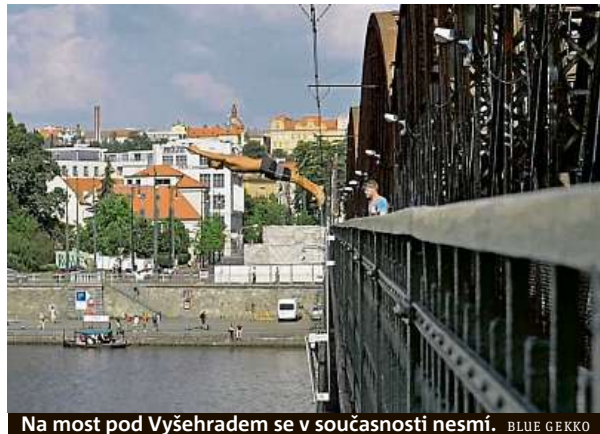
Na most pod Vyšehradem se v současnosti nesmí. BLUE GEKKO

Protože v Česku není moc dostupných míst, kde by se náš sport dal trénovat, a už se z toho stala jakási tradice. Loni jsme skákali z holešovického železničního mostu, mostu Inteligence a Mánesova mostu. Letos jsme si vybrali železniční most pod Vyšehradem, Libeňský most