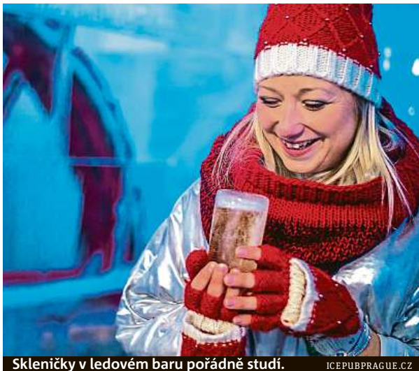
Skleničky v ledovém baru pořádně studí. ICEPUBPRAGUE.CZ

Chcete si zabruslit v rozpaleném létě? Není problém. Letos v únoru otevřeli zimní stadion Icerink ve Strašnicích a je k dispozici celý rok. Když jsme přicházeli k objektu, zrovna odcházel bývalý krasobruslař Tomáš Verner. Ten zde trénuje mladé naděje tohoto sportu. Na jednom ze dvou kluzišť si ale může zabruslit každý. Po chvíli je tu opravdu zima. Teploměr po dvaceti minutách klesl až na 9,4 stupně Celsia.