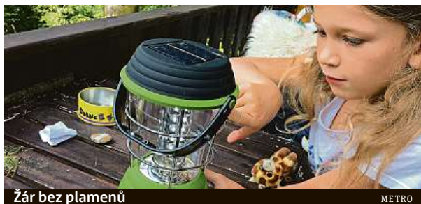
Žár bez plamenů

Kam složit v noci hlavu, když se vám nechce brát na letní hudební festival nebo na vodu drahý expediční stan? Anebo nechcete za stan na takovou akci utratit příliš?