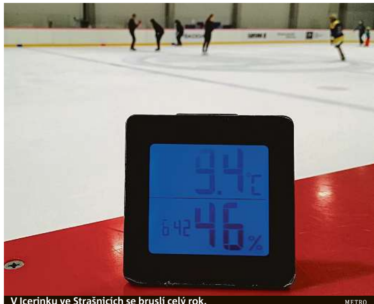
V Icerinku ve Strašnicích se bruslí celý rok.