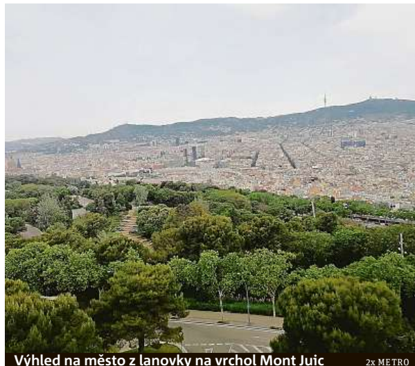
Výhled na město z lanovky na vrchol Mont Juic