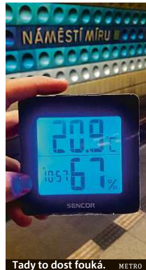
Tady to dost fouká. METRO

Bundu a rukavice dostanete při návštěvě ledového baru, který je součástí hudebního klubu Karlovy lázně. Takové teplé vybavení se vám