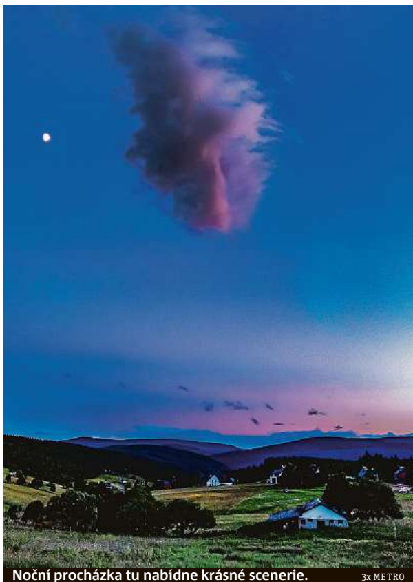
Noční procházka tu nabídne krásné scenerie.