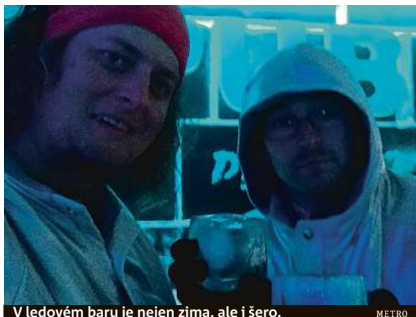
V ledovém baru je nejen zima, ale i šero. METRO