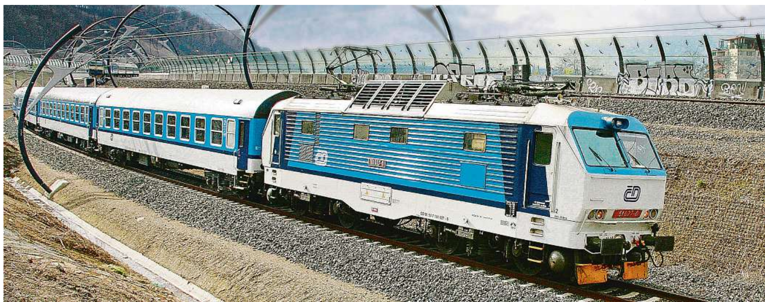
České dráhy se spojily s youtubery.