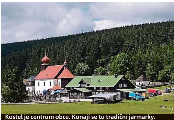
Kostel je centrum obce. Konají se tu tradiční jarmarky.

Pár let je tahákem i dětská Pohádková stezka z deseti krkonošskými pohádkami Marie Kubátové. A milovníkům historie doporučujeme Hornickou stezku, která ukáže památky po těžbě rud, přičemž lze nahlédnout i do štoly.