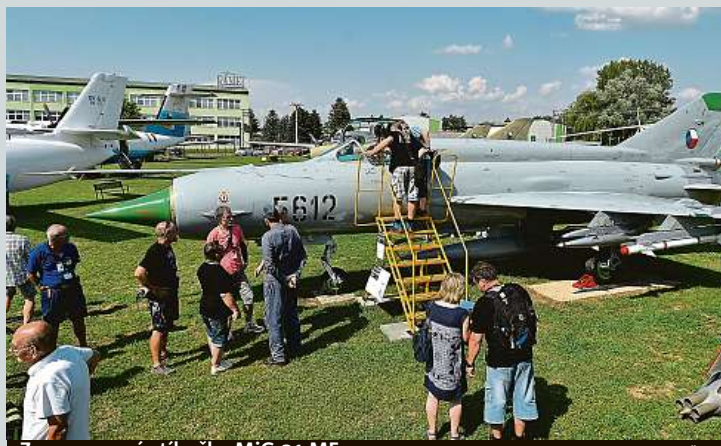
Zrenovaná stíhačka MiG-21 MF

Zrenovanou stíhačku MiG-21 MF odhalili pracovníci Leteckého muzea v Kunovicích. Takzvaná šedivka do něj loni zamířila z Technického muzea v Brně výměnou za letoun L-410. Práci na obnově stroje se muzejníci a dobrovolníci věnovali deset měsíců.