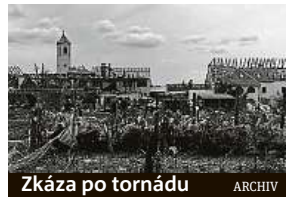
Zkáza po tornádu ARCHIV

Více informací na portálu www.ceskafilharmonie.cz .