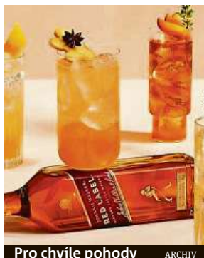
Pro chvíle pohody ARCHIV

V obchodním centru na Smíchově se daří dobrým drinkům.