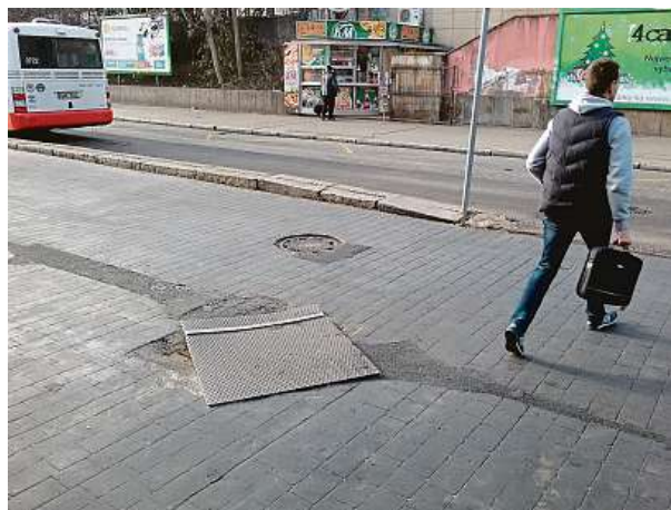
Vlevo fotografie nedbale zakryté díry pořízená začátkem prosince 2016 a vpravo její oprava 30. srpna dalšího roku.

Deník Metro se obratem spojil s tiskovým odborem Pražských služeb – největší svozovou společností v hlavním městě. Popelnice pod ně nespadała. Svozová firma se i přesto spojila s Technickou správou komunikací (TSK), která má v Praze na starosti stav a údržbu chodníků a silnic. TSK s pomocí své oblastní správy majitele vyhledala a vyzvala ho k odstranění popelnice i nepořádku v okolí. Popelnice, jež byla pravděpodobně partyzánštinou soukromé osoby či firmy, zmizela téhož dne. FILIP JAROŠEVSKÝ