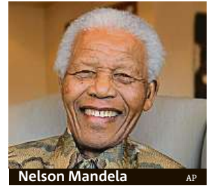
Nelson Mandela

Symbol boje proti rasistickému režimu apartheidu se stal Nelson Mandela, který pro své přesvědčení strávil víc než čtvrtstoletí ve vězení. Na svobodu se dostal až 11. února 1990, po více než 27 letech vězení. Za propuštění Mandela vděčil zejména politickým změnám, které v zemi nastaly po nástupu Frederika de Klerka do funkce prezidenta JAR. Po svém propuštění stanul Mandela v červenci 1991 v čele černošského Afrického národního kongresu, který přeměnil v silnou politickou stranu