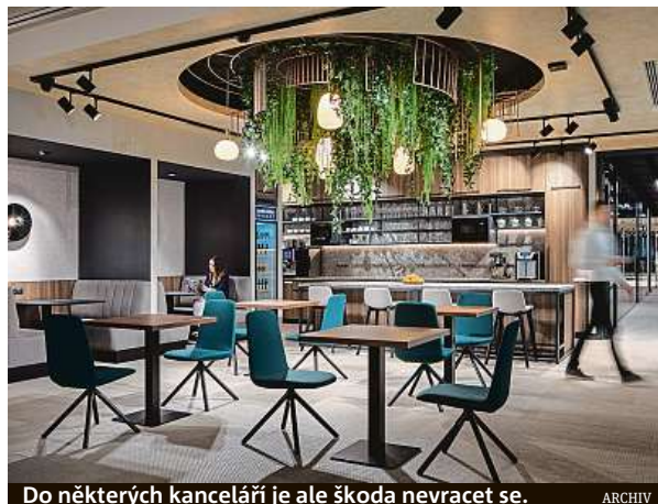
Do některých kanceláří je ale škoda nevracet se.

Podobné zkušenosti mají i ostatní firmy z oboru. Řada společností především z IT sektoru dokonce zatím návrat z home office ani nevyhlásila a nadále doporučuje pracovat z domu až do konce letošního roku. Plných sedesát procent firem je dle průzkumu ABSL a Colliers přesvědčeno o tom, že lidé nelze k návratu do firemních kanceláří nutit a že je potřeba je nechat samostatně rozhodovat o tom, kdy budou pracovat z kanceláře a kdy z domova. Například společnost SAP se na základě zpětné vazby svých lidí i pozitivních zkušeností s kvalitou výkonu práce na dálku rozhodla zavést flexibilní pracovní podmínky a umožnit zaměstnancům volit místo a čas práce dle jejich individuálních potřeb.