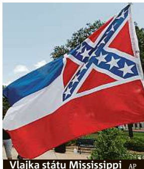
Vlajka státu Mississippi

Afroameričané tvoří ve státě Mississippi 38 procent obyvatelstva.