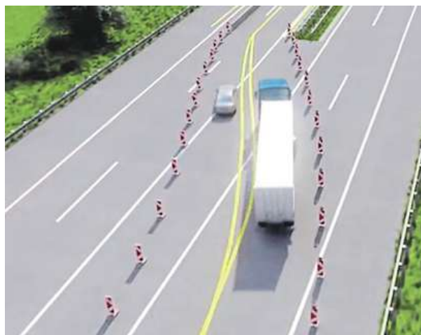
Rady pro řidiče najdete na youtube.com/ibesip/videos . YT