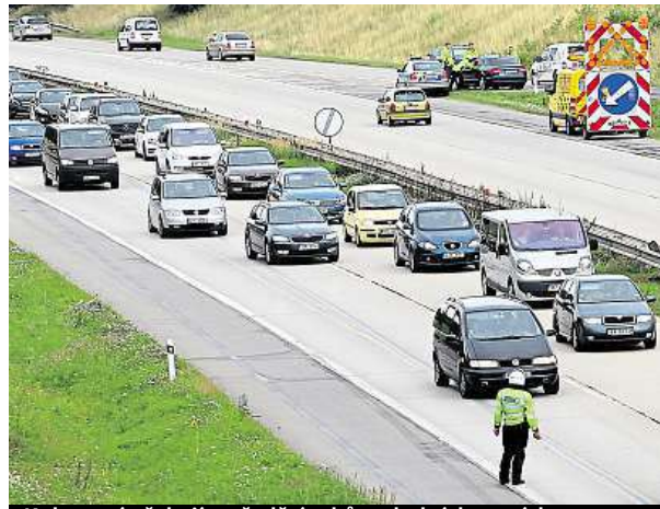
Kolony vás čekají na řadě úseků v okolních zemích.

O nadcházejícím víkendu ADAC předpokládá kvůli hraničním kontrolám delší čekací doby především na německo-rakouských přechodech