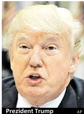
Prezident Trump

Bílý dům vydal k imigračnímu dekretu kritéria pro vstup do Spojených států.