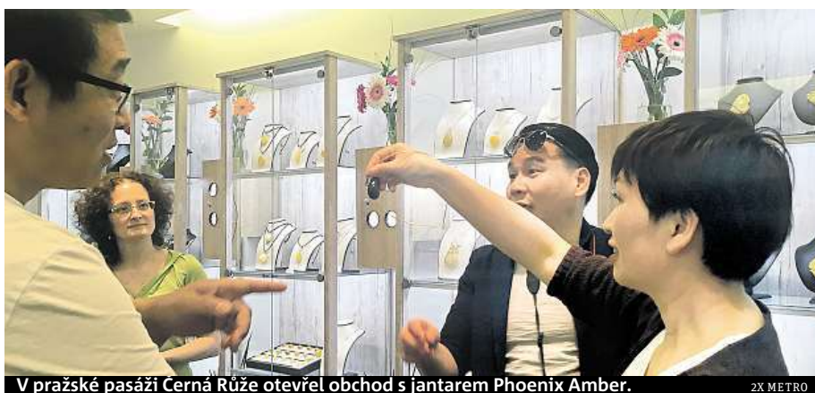
V pražské pasáži Černá Růže otevřel obchod s jantarem Phoenix Amber.