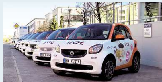
Flotila vozů smart ForTwo společnosti Účetnictví on-line, od Mercedes-Benz PRAHA.

Celkem máme k dnešnímu dni 12 vozidel smart. S chystanou expanzí do dalších měst bude ale jejich počet dále růst.