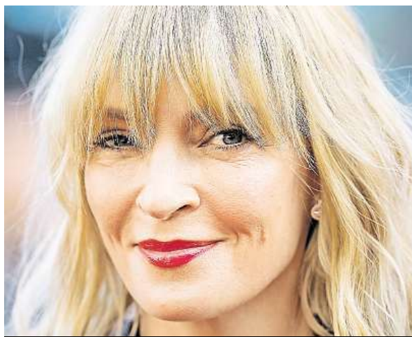
Uma před pár dny na festivalu v Cannes