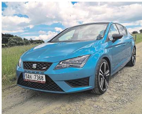
Světlemodrá metaliza Seatu Leon Cupra sluší.