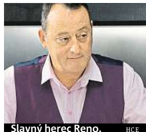
Slavný herec Reno. HCE

edmašedesátiletý Reno si popularitu zajistil hlavně díky spolupráci s režisérem Lu-