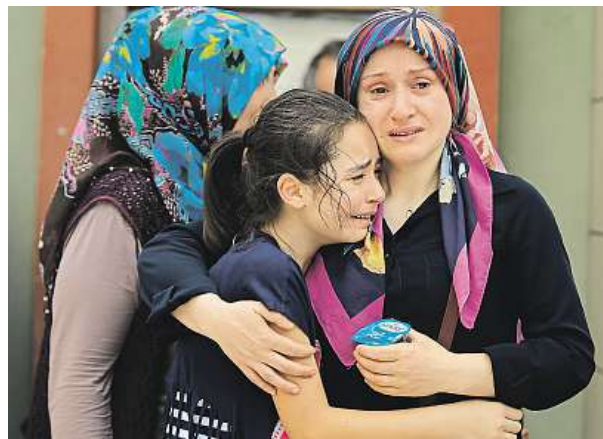
Pozůstali po obětech atentátů jsou zdrcení.

Podle informací istanbulského guvernéra je většina obětí turecké národnosti, nejméně 13 jsou cizinci. Češi mezi oběťmi nefigurují. Turecké aerolinie zrušily 340 letů, omezení se dotklo i leteckých spojů s Prahou. Provoz na letišti se již průběžně obnovuje. Některé země včetně Česka zpřísnily bezpečnostní opatření na letištích.