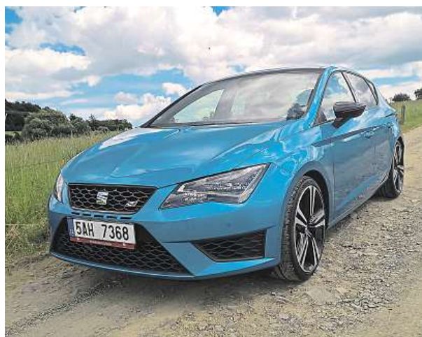
Světlemodrá metaliza Seatu Leon Cupra sluší.