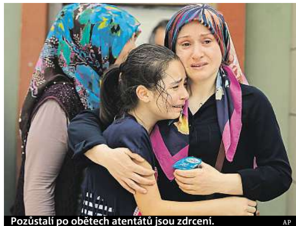
Pozůstali po obětech atentátů jsou zdrcení.

Podle informací istanbulského guvernéra je většina obětí turecké národnosti, nejméně 13 jsou cizinci. Češi mezi oběťmi nefigurují. Turecké aerolinie zrušily 340 letů, omezeny se dotkly i leteckých spojů s Prahou. Provoz na letišti se již průběžně obnovuje. Některé země včetně Česka zpřísnily bezpečnostní opatření na letištích.