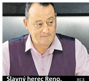
Slavný herec Reno. HCE

edmašedesátiletý Reno si popularitu zajistil hlavně díky spolupráci s režisérem Lu-