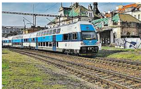
Barrandovské terasy (nahore) zarůstají stejně jako nádraží Vyšehrad.