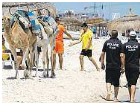
Pláže hlídají policisté.

Nepomůže ani změnit letoviště v nedobytné pevnosti.