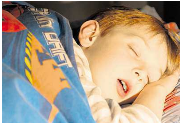
K pomočování může vést i stres.

Podle studií má tyto potíže až 15 procent dětí ve věku pěti let. Příčin je celá řada. „V případě nočního pomočování se pravděpodobně jedná pouze o opožděné dozrávání močového měchýře a nervových regulačních mechanismů. U těchto dětí je tedy pouze otázka času, kdy se jim podaří získat plnou kontrolu a již se nepomočovat. U dětí, které mají denní obtíže s mo-