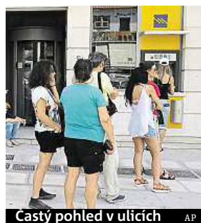
Castý pohled v ulicích

A tak mnoho Řeků podle agentury AFP tráví spoustu času čím dál tím zoufalejším hledáním funkčních bankomatů, aby si vybrali co nejvíc peněz v době nejistoty a stra-