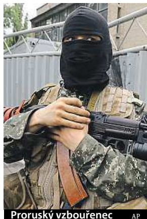
Proruský vzbouřenec

Zadržený velitel jedné z povstaleckých jednotek na východě Ukrajiny má přezdívku Čech.