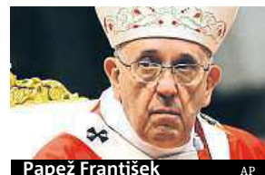
Papež František

Podle papeže Františka okopírovali komunisté od křesťanů téma ochrany chudých. Sedmasedmdesátiletý papež reagoval na vyjádření v blogu časopisu The Economist, že působil jako obránce doktríny leninismu, když kritizoval kapitalismus a vyzval k radikálním ekonomickým reformám. „Mohu říci jen to, že komunisté ukradli naši vlajku. Vlajka chudých je křesťanská. Chudoba je středem evangelia.“ ČTK