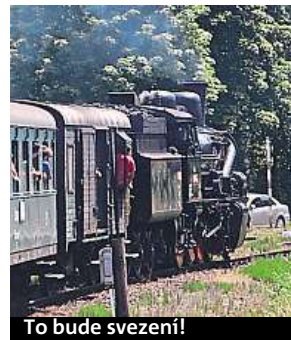
To bude svezení!

Z nádraží Praha Braník vyjede tuto sobotu v 9:02 na trať legendárního Posázavského pacifiku vlak v čele s parní lokomotivou 434.2186 Čtyřkolák z roku 1917. Asi největším lákadlem jízdy směr Kácov bude tradiční Prokopská pouť v Sázavě. Zájemce o historii zaujme prohlídka Sázavského kláštera a Hutí František, která je umístěna v centru sklářského umění. Více na www.cd.cz/zazitky . MET