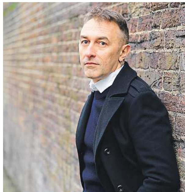
Cím by byla Amélie z Montmartru bez Tiersenovy hudby?

Tiersen vystudoval hru na klavír a violu, ale bravurně ovládá také akordeon, elektrickou kytaru, xylofon, zvonkohru a snad všechny dechové nástroje.