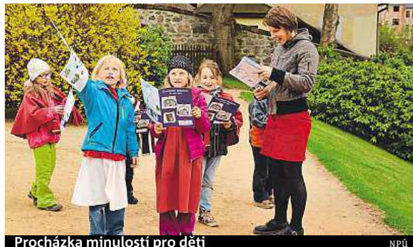
Procházka minulostí pro děti