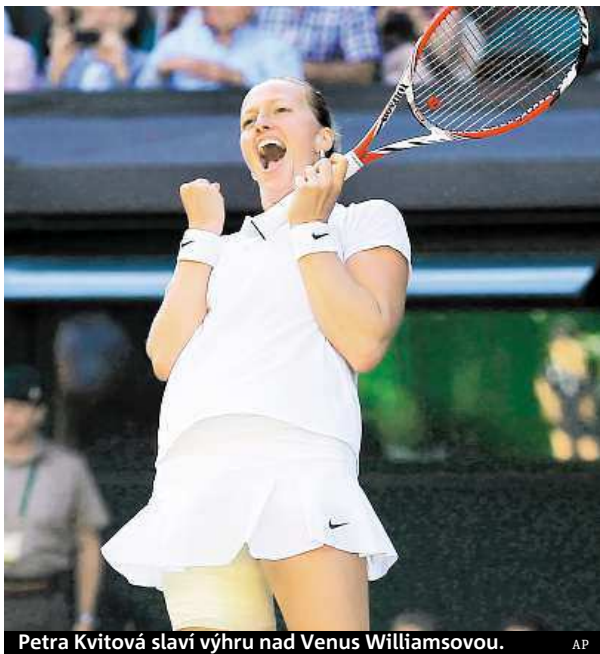
Petra Kvitová slaví výhru nad Venus Williamsovou.

je Barbora Záhlavová-Strýcová, které se ve třetím kole londýnského turnaje podařilo vyřadit světovou dvojku Li Na. Nyní ji čeká Caroline Wozniacká z Dánska. „Wozniacká toho tolik nezkaží jako Li Na,