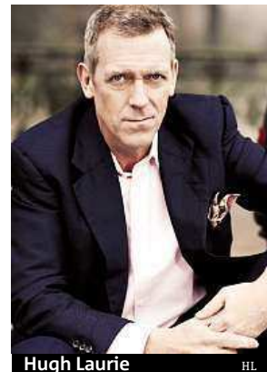
Hugh Laurie

Den před brněnským koncertem vystoupí Laurie ještě v Bratislavě. METRO