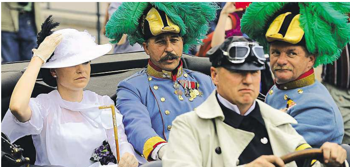
Svět si v sobotu připomněl 100 let od sarajevského atentátu na Ferdinanda D' Este. V Brně se konala rekonstrukce události.

Nekažte si dovolenou. V zahraničí je dobré být obezřetný, ztráta dokladů či peněz vám může pěkně znepríjemnit letní relaxaci. Madrid a Londýn. Především v těchto městech své věci hlídejte STRANA 7