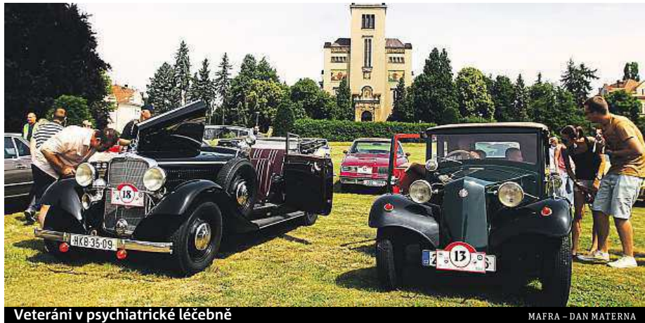
Veteráni v psychiatrické léčebně