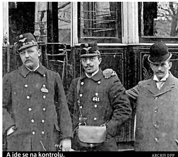
A jde se na kontrolu.

Zavedení pokut ale neznamená, že do té doby neexistovali revizori. Ti prováděli kontrolu od počátku, tedy i na koňspřežné tramvaji. „Neměli na starosti jen nezbedné ces-