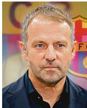
Hansi Flick během 80. let hrával za Bayern Mnichov.

Devětapadesátiletý Flick působil v letech 2019 až 2021 na lavičce Bayernu. S bavorským celkem vyhrál sedm trofejí, mimo jiné s ním dvakrát ovládl bundesligu a jednou i Ligu mistrů, Superpohár UEFA nebo klubové mistrovství světa.