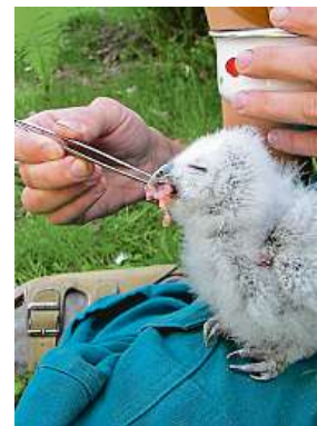
Krmení spokojeného puštíka ve Vlašimi