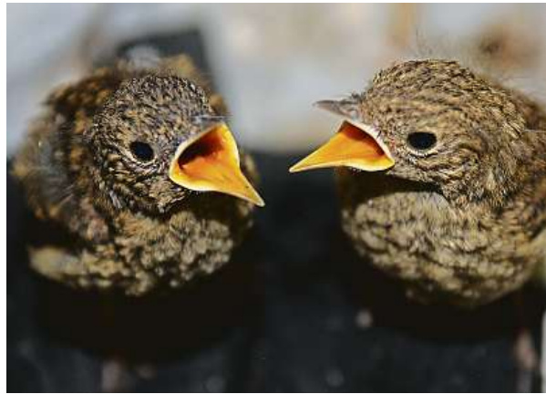
Krmení mláďat v Záchrané stanici Vlašim. Ta pomáhá malým i velkým živočichům v nouzi již od roku 1994.