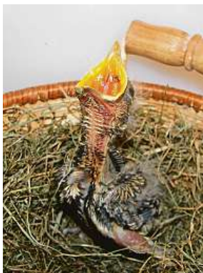
Mláďe drozda se mělo k světu v Záchrané stanici Vlašim.

FILIP JAROŠEVSKÝ filip.jarosovsky@metro.cz