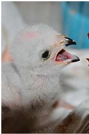
Umělý odchov krahujce obecného ve stanici Buchlovice