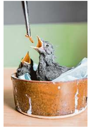
Pokud jste našli poraněné zvíře, pomohou i ve stanici Pavlov.

Ptačí mláďata mnohdy zbytečně opět zahlcují záchrané stanice. Každoroční evergreen ideálně končí po telefonu.