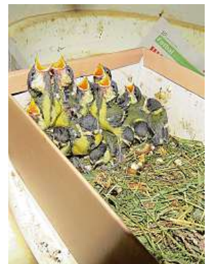
V Bartošovicích měli celou velkou rodinu sýkorek koňader.