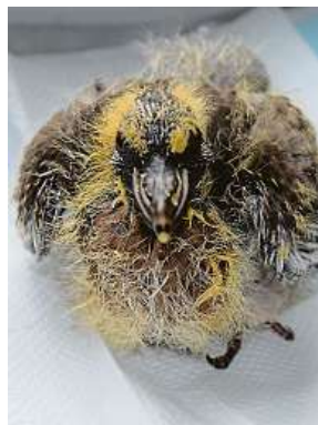
Holub hřivnáč se kvůli nehodě dostal do stanice v Hrachově.