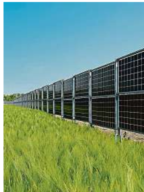
Na poli by mohly být i vertikální fotovoltaiické panely. FEL ČVUT

Solární panely umístěné například nad sady nebo vinicemi chrání plodiny před příliš silným letním sluncem, krupobitím a třeba i před ne-