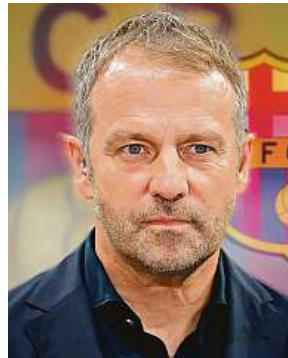
Hansi Flick během 80. let hrával za Bayern Mnichov.

Devětapadesátiletý Flick působil v letech 2019 až 2021 na lavičce Bayernu. S bavorským celkem vyhrál sedm trofejí, mimo jiné s ním dvakrát ovládl bundesligu a jednou i Ligu mistrů, Superpohár UEFA nebo klubové mistrovství světa.