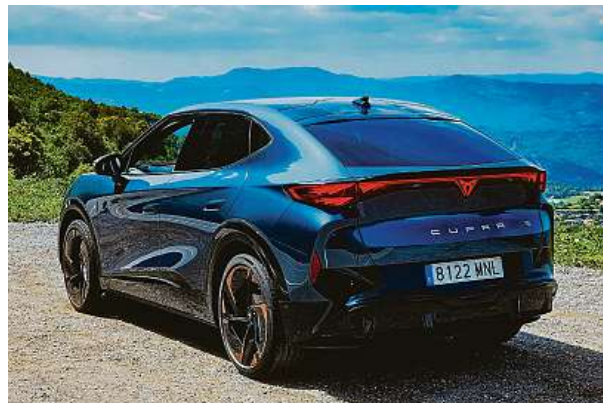
Cupra Tavascan lze dobíjet výkonem až 135 kW. Během prvních jízd jsme to ale nevyzkoušeli. Líbí se nám grafika zadních lamp. 2x METRO

Žraločí tlama se dostala na evropské silnice. Nejvýraznější model značky Cupra jsme vyzkoušeli ve Španělsku. Jezdí skvěle.