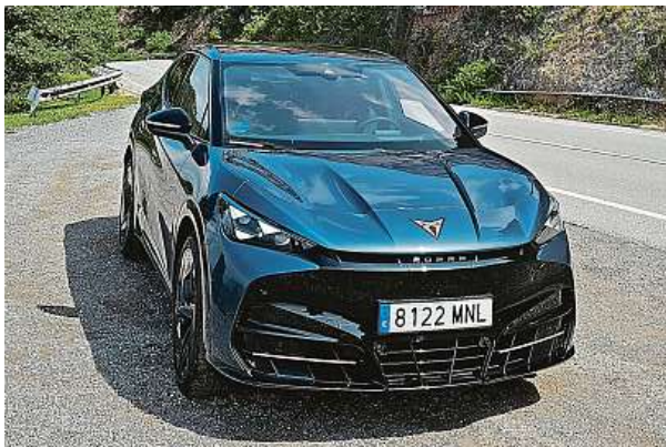
Celkových 340 koní produkovaných dvěma elektromotory zajistí, že se na stovku z nuly dostanete už za 5,6 sekundy.