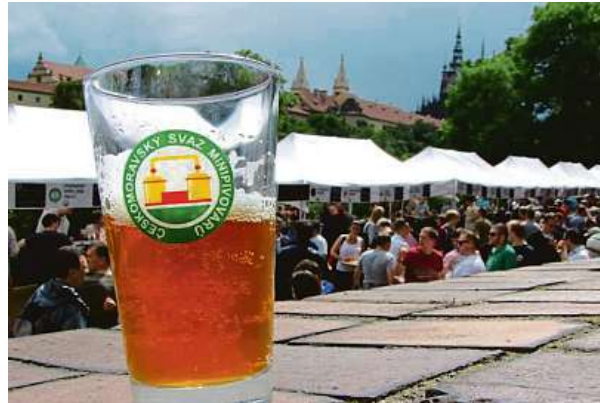
Pivní festival na Pražském hradě je atraktivní i svým místem. ČMSMP

Návštěvníci mohou ochutnat přes 100 druhů piv 33 různých stylů.