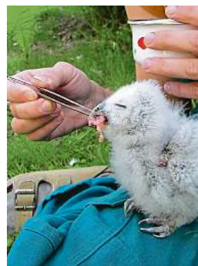
Krmení spokojeného puštíka ve Vlašimi