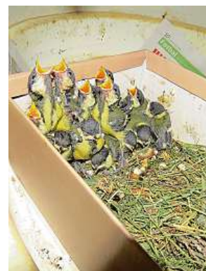
V Bartošovicích měli celou velkou rodinu sýkorek koňader.