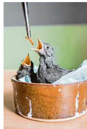
Pokud jste našli poraněné zvíře, pomohou i ve stanici Pavlov.

Ptačí mláďata mnohdy zbytečně opět zahlcují záchrané stanice. Každoroční evergreen ideálně končí po telefonu.