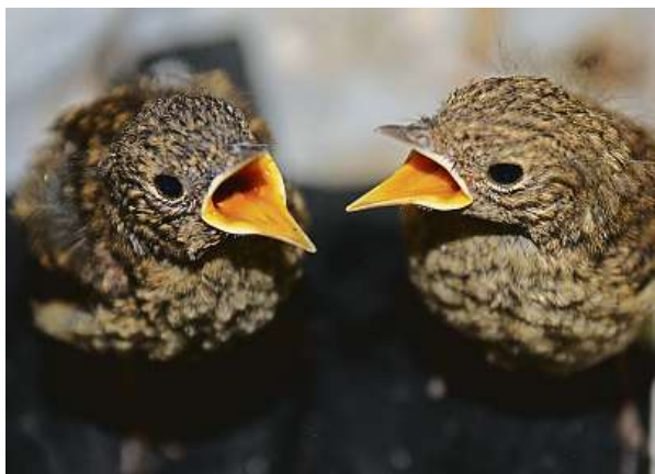
Krmení mláďat v Záchrané stanici Vlašim. Ta pomáhá malým i velkým živočichům v nouzi již od roku 1994.