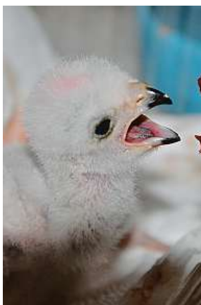
Umělý odchov krahujce obecného ve stanici Buchlovice