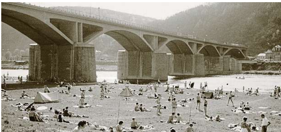
Fotografie mostu Inteligence z roku 1962. Louka na branické straně vybízela k oddechu.

Byla sobota 30. května 1964 a most nad Vltavou mezi Braníkem a Malou Chuchlí konečně ožil. Řadu let tu stál bez užtku, protože nebyl napojen na žádnou trať.