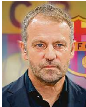
Hansi Flick během 80. let hrával za Bayern Mnichov.

Devětapadesátiletý Flick působil v letech 2019 až 2021 na lavičce Bayernu. S bavorským celkem vyhrál sedm trofejí, mimo jiné s ním dvakrát ovládl bundesligu a jednou i Ligu mistrů, Superpohár UEFA nebo klubové mistrovství světa.