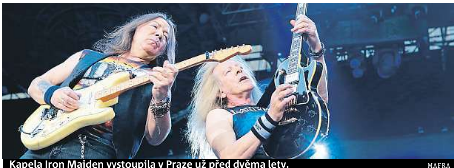
Kapela Iron Maiden vystoupila v Praze už před dvěma lety.

Z kopce se pojede už tento víkend. Vysočanská O, arena totiž nabídne zajímavý dvojboj – vystoupí zde houslový virtuos André Rieu a po něm americký multiinstrumentalista Lenny Kravitz. Pokud v této hale zůstaneme, můžete se těšit v pátek 8. června na akci nazvanou Elvis in Con-