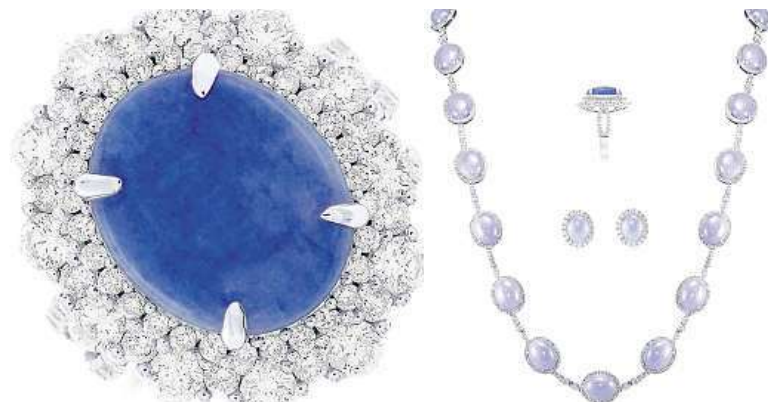
Jedinečná sada klenotů za miliony korun je v Česku.

Jadeity se těží především v Asii, nejčastěji pak v Barmě, Bangladéši, Číně nebo právě Japonsku. Investiční šperky se povětšinou zhotovují z čirých diamantů. PH