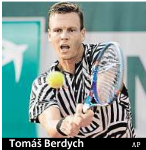
Tomáš Berdych

Z dalších českých tenistů se dařilo ve čtyřhře dvojici Andrea Hlaváčková a Lucie Hradecká. Ta porazila ve třetím kole 6:4, 6:1 slovinský pár Andreja Klepačová, Katarina Srebotniková. Češky si tak zahrají v deblu čtvrtfinále.