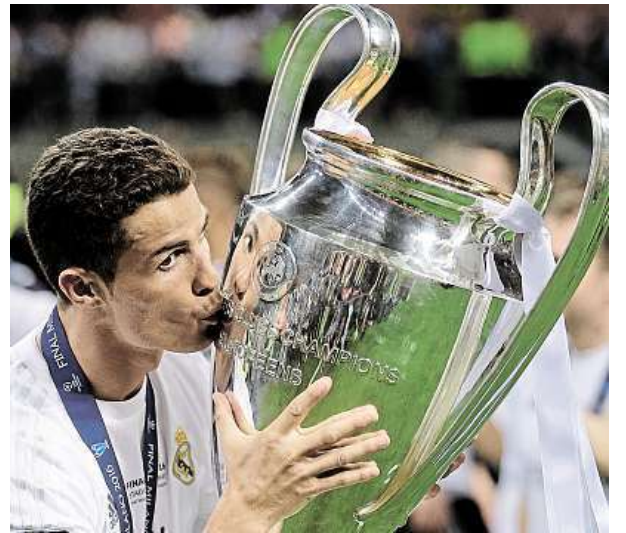
Cristiano Ronaldo s pohárem pro vítěze Ligy mistrů

V prodloužení gól nepadal, a tak tentokrát musely rozhodnout až penalty. Prvních sedm střelců bylo sto procentních, pak ale Juanfran z Atlético trefil tyč. Následně se nemýlil kanonýr Realu Cristiano Ronaldo a mohl začít se svými spoluhráči slavit. Bílý balet vyhrál Ligu mistrů už po jedenácté v historii.