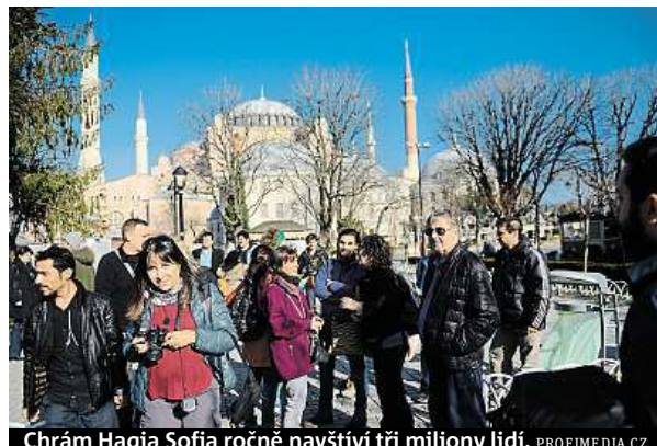
Chrást Hagia Sofia ročně navštíví tři miliony lidí.

„Ve jménu stovek tisíc věřících požadujeme, abychom se mohli modlit uvnitř mešity Hagia Sofia,“ prohlásil předseda Sdružení anatolské mláde-