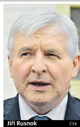
Jiří Rusnok

To jsou po víkendů hlavní sdělení Jiřího Rusnoka, kterého ve středu jmenoval prezident Miloš Zeman guvernérem ČNB. „Obecně si myslím, že do eurozóny patříme, ale čas nedozrál mentálně, politicky. Když děláme rozumnou měnovou a fiskální politiku, můžeme žít i s vlastní měnou,“ řekl včera v České televizi. Rusnok ve funkci od července nahradí Miroslava Singera, kterému končí druhý šestiletý mandát a nemůže být znovu jmenován. „Naše posunutí bude většinově méně euroskeptické, byť kri-