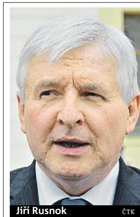
Jiří Rusnok

To jsou po víkendu hlavní sdělení Jiřího Rusnoka, kterého ve středu jmenoval prezident Miloš Zeman guvernérem ČNB. „Obecně si myslím, že do eurozóny patříme, ale čas nedozrál mentálně, politicky. Když děláme rozumnou měnovou a fiskální politiku, můžeme žít i s vlastní měnou,“ řekl včera v České televizi. Rusnok ve funkci od července nahradí Miroslava Singera, kterému končí druhý šestiletý mandát a nemůže být znovu jmenován. „Naše posunutí bude většinově méně euroskeptické, byť kri-