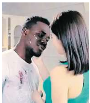
Před a po v kontroverzní čínské reklamě