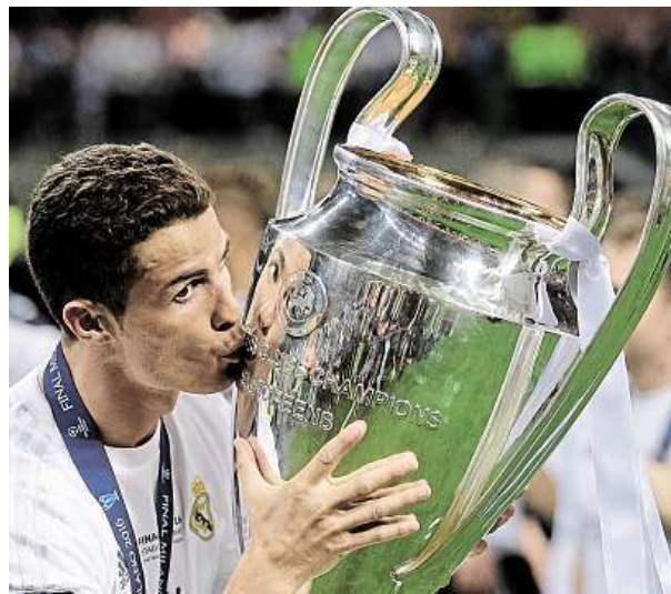
Cristiano Ronaldo s pohárem pro vítěze Ligy mistrů

V prodloužení gól nepadal, a tak tentokrát musely rozhodnout až penalty. Prvních sedm střelců bylo stoprocentních, pak ale Juanfran z Atlético trefil tyč. Následně se nemýlil kanonýr Realu Cristiano Ronaldo a mohl začít se svými spoluhráči slavit. Bílý balet vyhrál Ligu mistrů už po jedenácté v historii.