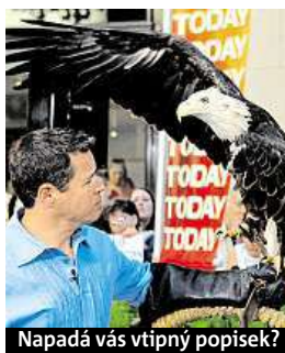
Napadá vás vtipný popisek?

Napište bublinu a reagujte na sloupek na: www.facebook.com/denikmetro