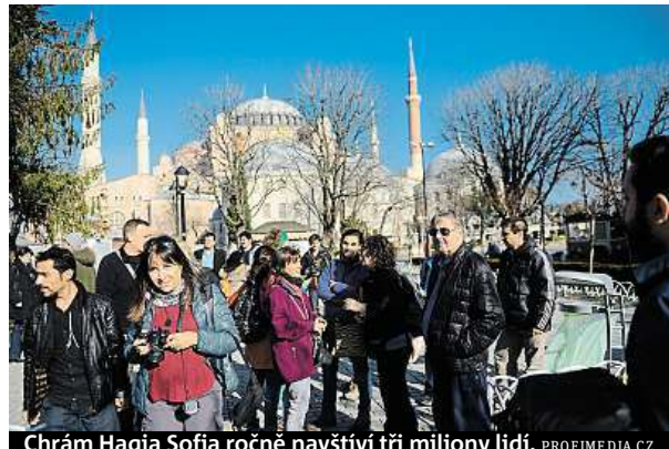
Chrám Hagia Sofia ročně navštíví tři miliony lidí.

„Ve jménu stovek tisíc věřících požadujeme, abychom se mohli modlit uvnitř mešity Hagia Sofia,“ prohlásil předseda Sdružení anatolské mláde-