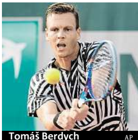
Tomáš Berdych

Z dalších českých tenistů se dařilo ve čtyřhře dvojici Andrea Hlaváčková a Lucie Hradecká. Ta porazila ve třetím kole 6:4, 6:1 slovinský pár Andreja Klepačová, Katarina Srebotniková. Češky si tak zahrají v deblu čtvrtfinále.