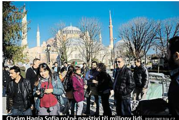
Chrám Hagia Sofia ročně navštíví tři miliony lidí.

„Ve jménu stovek tisíc věřících požadujeme, abychom se mohli modlit uvnitř mešity Hagia Sofia,“ prohlásil předseda Sdružení anatolské mláde-