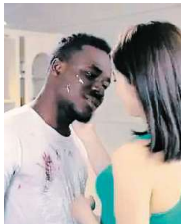
Před a po v kontroverzní čínské reklamě

Podle Global Times je čínská reklama plagiátem italského vzoru. Ačkoliv reklama v samé Číně po nasazení na počátku roku nevyvolala žádné kontroverze, nyní i někteří čínští uživatelé sociální sítě Weibo vyjadřují „rozpaky“. Připomněla, že Čína tradičně dává přednost mužům a ženám bílé pleti, kteří odpovídají zažitým představám krásy. K odmítání černochů přispívá i nedostatek etnické rozmanitosti v médiích, přestože rostoucí obchod s Afrikou vedl ke zvýšení počtu Afričanů v Číně. ČTK