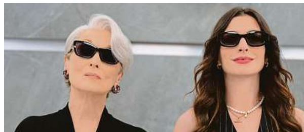
Miranda (vlevo) a Andrea si získaly fanoušky po celém světě.

Emily (Emily Bluntová) mezitím zakotvila ve světě luxusu a pracuje pro Dior, což je vlastně přesně ten typ kariérního posunu, který jí perfektně sedí. Novou energii do fil-