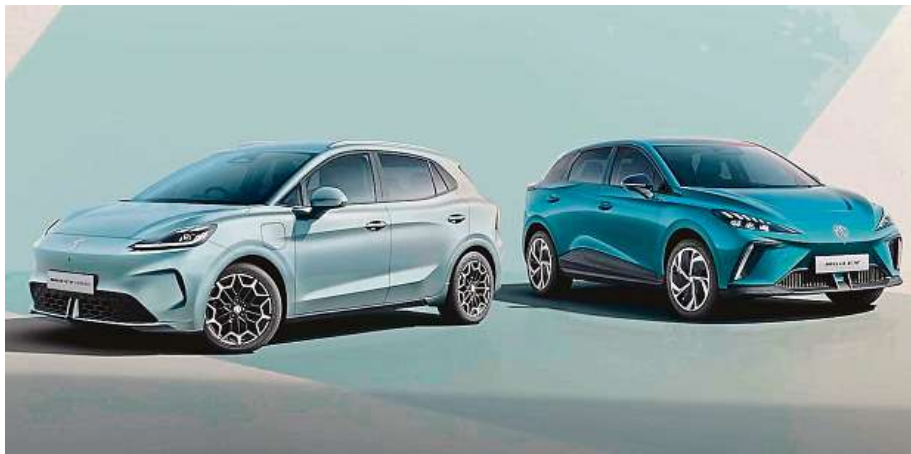
MG4 Electric ve verzi Urban nebude jen levný elektromobil. Je to začátek celé nové generace modelů. MG

Verze Urban je klíčová. Má být nejdostupnější variantou celé nabídky a otevřít elektromobilitu širšímu publiku. Menší baterie, jednodušší