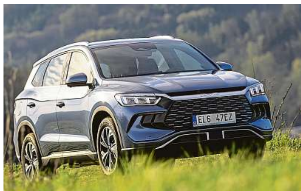
Cena, prostor a každodenní použitelnost – tohle dává smysl.