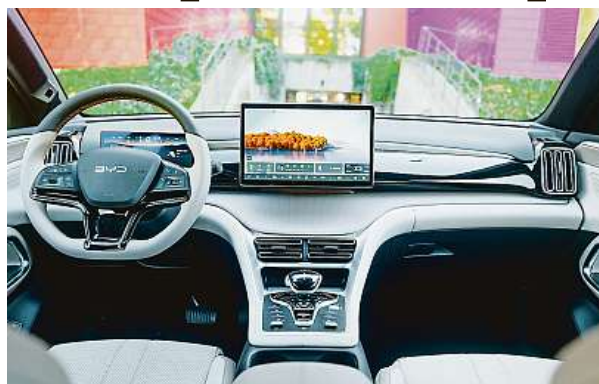
BYD Sealion 5 DM-i není bez chyb. Asistenti umí lézt na nervy. 2x BYD