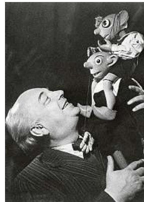
Josef Skupa (1892–1957) se Spejblem a Hurvínkem

V té době měl za sebou Spejbl téměř čtvrtstoletí úspěšného předvádění na jevištích, Skupa jej divákům poprvé představil na podzim 1920. Zprvu ušatý panák, který do všeho rád „vrtá“, vystu-