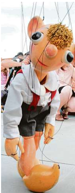
Hurvínek je patrně nejoblíbenější loutková postava v Česku.

Hurvínek, jedna z nejmilovanějších postavček českého loutkářství, v sobotu oslaví sto let od svého prvního představení.