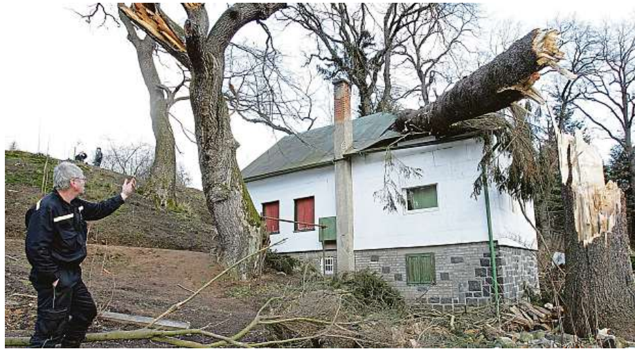
Před devatenácti lety se nad Českem přehnal orkán Kyrill. Devastoval města i vesnice, velké škody tehdy napáchal na lesních porostech i na nemovitostech.

„Mnoho majitelů domů se zaměřuje pouze na samotnou stavbu, ale zapomíná na další prvky kolem domu. Bouřky často poškozují i ploty, pergoly, zahradní domky nebo třeba bazény. Ne všechny tyto věci jsou automaticky