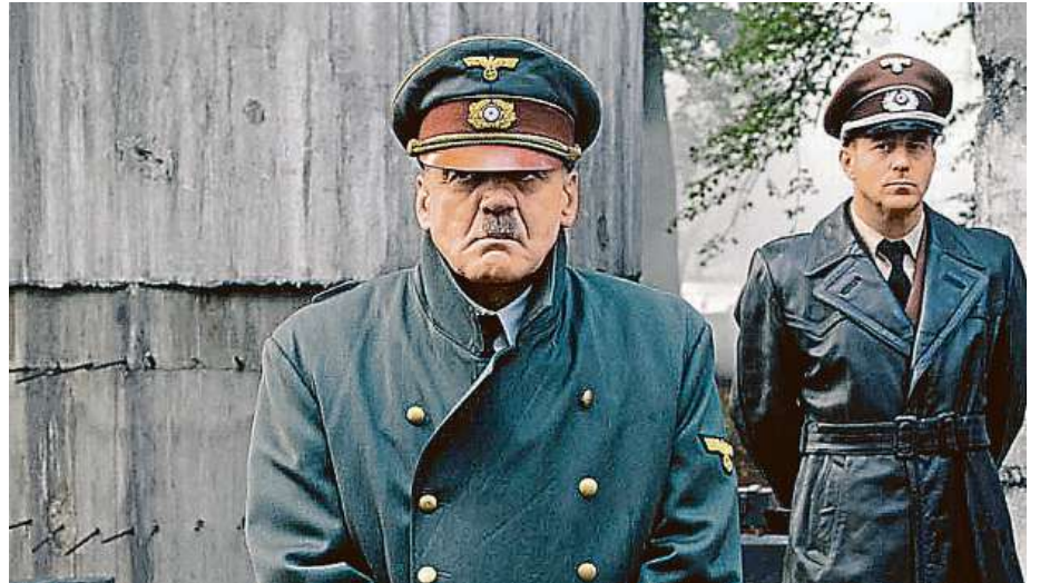
Zatím poslední filmový Hitler v jedinečném a velice přesvědčivém podání již nežijícího Bruna Ganz. Pád třetí říše vycházel z velké části i z deníku Hitlerovy osobní sekretářky Traudl Jungeové.

Zatuchlina pod kancléřstvím Poslední okamžiky Hitlerova života popisují především dva filmy. Již zmiňovaný Pád třetí říše z roku 2004, kdy jak