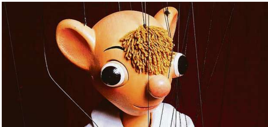
Okatý drzoun Hurvíněk

V té době měl za sebou Spejbl téměř čtvrtstoletí úspěšného předvádění na jevištích, Skupa jej divákům po-