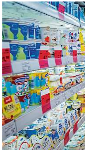
Zítří si ve všech obchodech vyberete, co potřebujete.

První máj proběhne ve znamení plné dostupnosti služeb. Protože se na 1. květen 2026 nevztahuje zákonné omezení prodeje, supermarkety, hypermarkety i nákupní centra budou mít otevřeno podle běžné provozní doby. Zákazníci tak mohou bez obav vyrazit na nákupy potravin i hobby sortimentu bez jakéhokoli omezení. REI