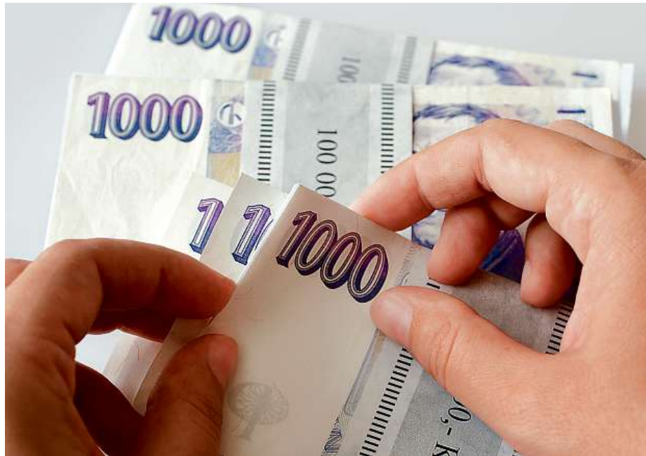
Správný výběr a výpočet životního pojištění hraji stále větší roli v neočekávaných situacích, které mohou zásadně zasáhnout do života každé rodiny.

„Pojistná částka by měla pomoci pokrýt zejména dlouhodobý výpadek příjmů, splácení úvěrů nebo náklady na péči,“ doplňuje Urbaníková Volná z ČPP. Zde vzniká často zádrhel, řada lidí si nastaví pojistnou částku příliš nízkou. Na důležitost správného nastavení upozorňuje i Míla Káňa z Kooperativy: „Klient by měl především rozumět tomu, proč má sjednané každé jednotlivé připojištění, a vědět, jak funguje.“ PH