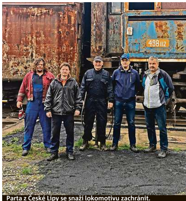
Parta z České Lípy se snaží lokomotivu zachránit.