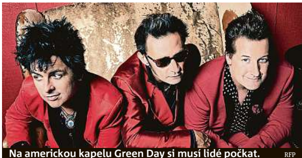
Na americkou kapelu Green Day si musí lidé počkat. RFP

Covid kosí větší kulturní akce jako na běžícím pásu. Navíc druhé léto po sobě. To se týká i festivalu Rock for People . Ten je vyprodán od led-