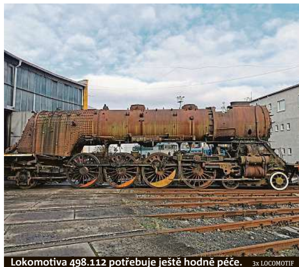
Lokomotiva 498.112 potřebuje ještě hodně péče. 3x LOCOMOTIF

Momentálně se Locomotif podílí na opravě parní lokomotivy 498.112 Albatros.