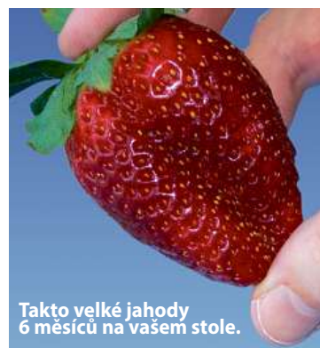
Takto velké jahody 6 měsíců na vašem stole.

Ano, nyní se již nepotřebujete ohýbat, abyste sbírali na zemi a v blátě jahody, které napadli živočišné ještě předtím, než byly zralé.