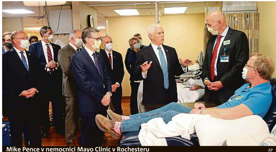
Mike Pence v nemocnici Mayo Clinic v Rochesteru

Viceprezident tvrdí, že je pravidelně testován na koronavirus.