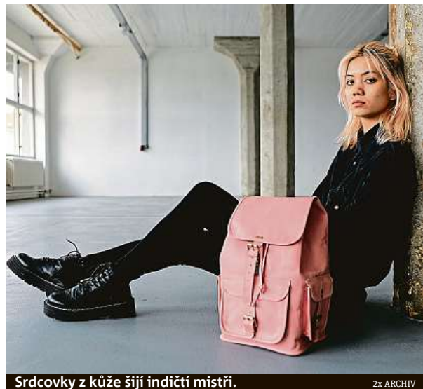
Srdcovky z kůže šiji indiští mistři.

Gró celého Bagindu je mix všeho, co děláme. Máme silný a kvalitně zpracovaný příběh, nabízíme originální výrobek, který je v našich končinách ojedinělý, přistupuje-