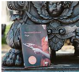
Ulovte si knihu LUXOR.CZ