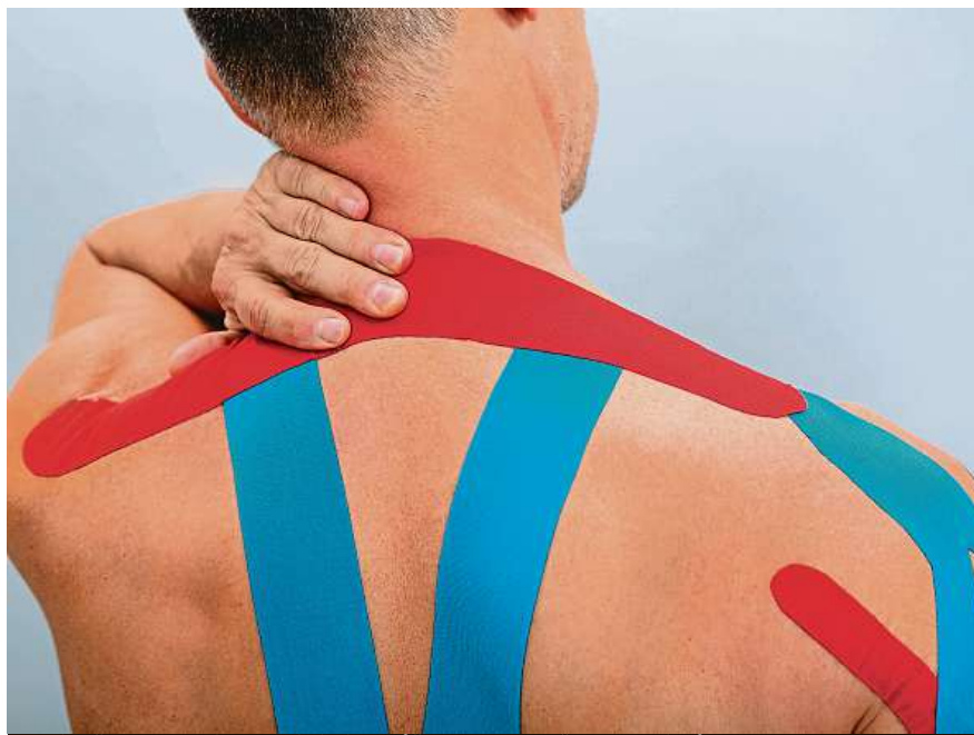
Správně provedené tejpování vám může ulevit od vašich problémů.

Důležité ale je, jak se tejp umístí – vždy se využívá přímo na sval, který je namožený, natržený nebo jinak poškozený a oslabený. A to po celé jeho délce – tedy od úponu k úponu. Pokud je oslabeno v jedné partii více svalů, vždy se využívá na každý sval vlastní tejp. Tejpování lze rozdělit dle způsobu použití na pevné tejpování pomocí tuhých, většinou bílých pásek, a kineziotaping, při němž se používají elasticke barevné pásky. Pevné tejpování se používá hlavně pro zpevnění míst na těle, která mají mít oporu o tuto pásku – například prsty volejbalistů či kotníky basketbalistů.