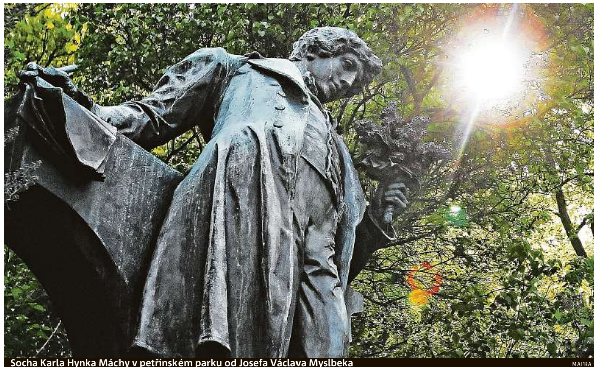
Socha Karla Hynka Máchy v petřínském parku od Josefa Václava Myslbeka

Třeba stavění májkek, tedy ozdobeného kmene stromu vztýčeného na vesnicích, je známo i z Velké Británie. Tam odpovídalo staletým tradicím symbolizujícím zisk požeňání ducha lesa. V Če-