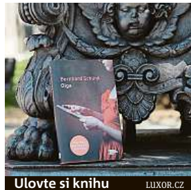
Ulovte si knihu LUXOR.CZ