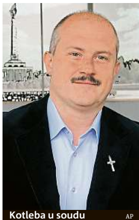
Kotleba u soudu