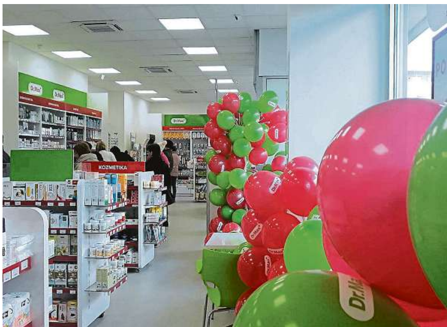
Otvírání lékárny Dr. Max v srbském Zaječaru

Internetový prodej představuje prvek firmy Dr. Max, který se s úspěchem vyvíjí v rámci rozšiřování sítě i do zahraničí. Síť působí už v pěti zemích Evropy, kde má přes 2100 lékáren.