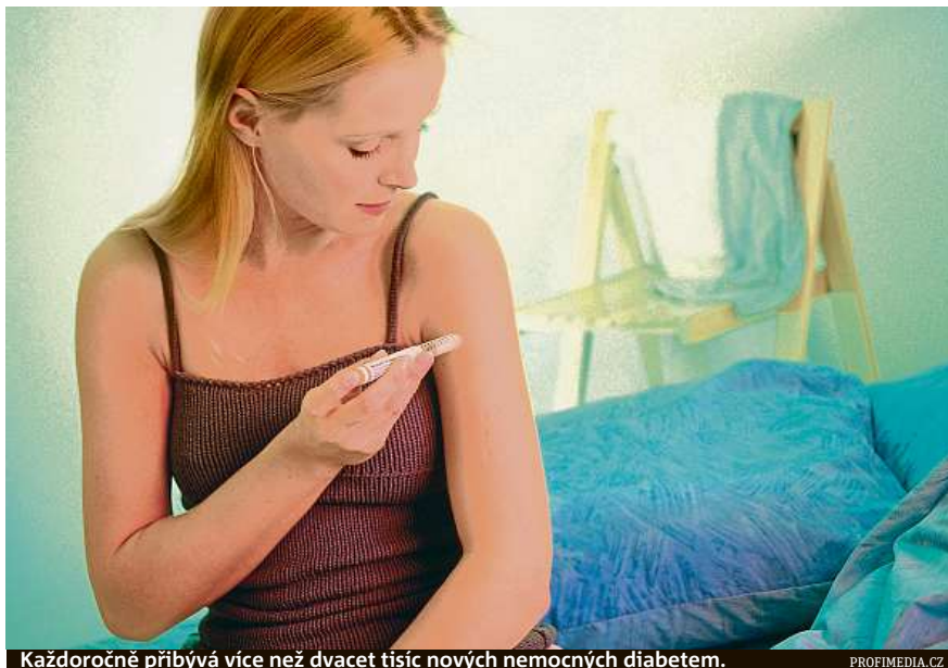
Každoročně přibývá více než dvacet tisíc nových nemocných diabetem.

Je to ohraná písnička a milovníci pravé české tučné kuchyně ji neradi slyší. Přesto se odborníci shodují, že jedním z nejlepších preventivních opatření je zdravé str-