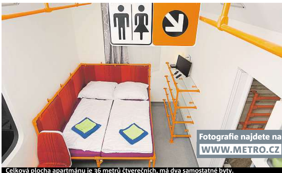
Celková plocha apartmánu je 36 metrů čtverečních, má dva samostatné byty.

la firma Altro podlahoviny. U něčeho jsem byl velmi zaskočen cenou, například žlutá kovová krabice na označovač jízenek bez vnitřku, tedy pouze obal, stojí pět tisíc.