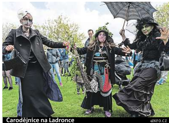
Čarodějnice na Ladronce