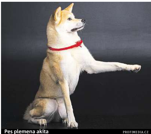
Pes plemena akita

Pověst zvířete ještě vzrostla počátkem roku, když olympijská vítězka Alina Zagitová prohlásila, jak tyto psy miluje, poté co je poznala, když v Japonsku trénovala. Místní představitel jí jednoho nabídl.